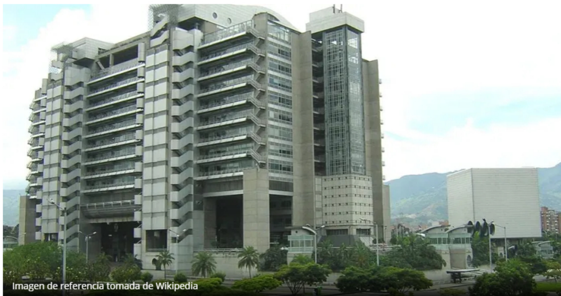
Imagen de referencia tomada de Wikipedia

Fecha: 12 septiembre, 2020 Categoría: Opinión Autor: Héctor Vásquez Fernández