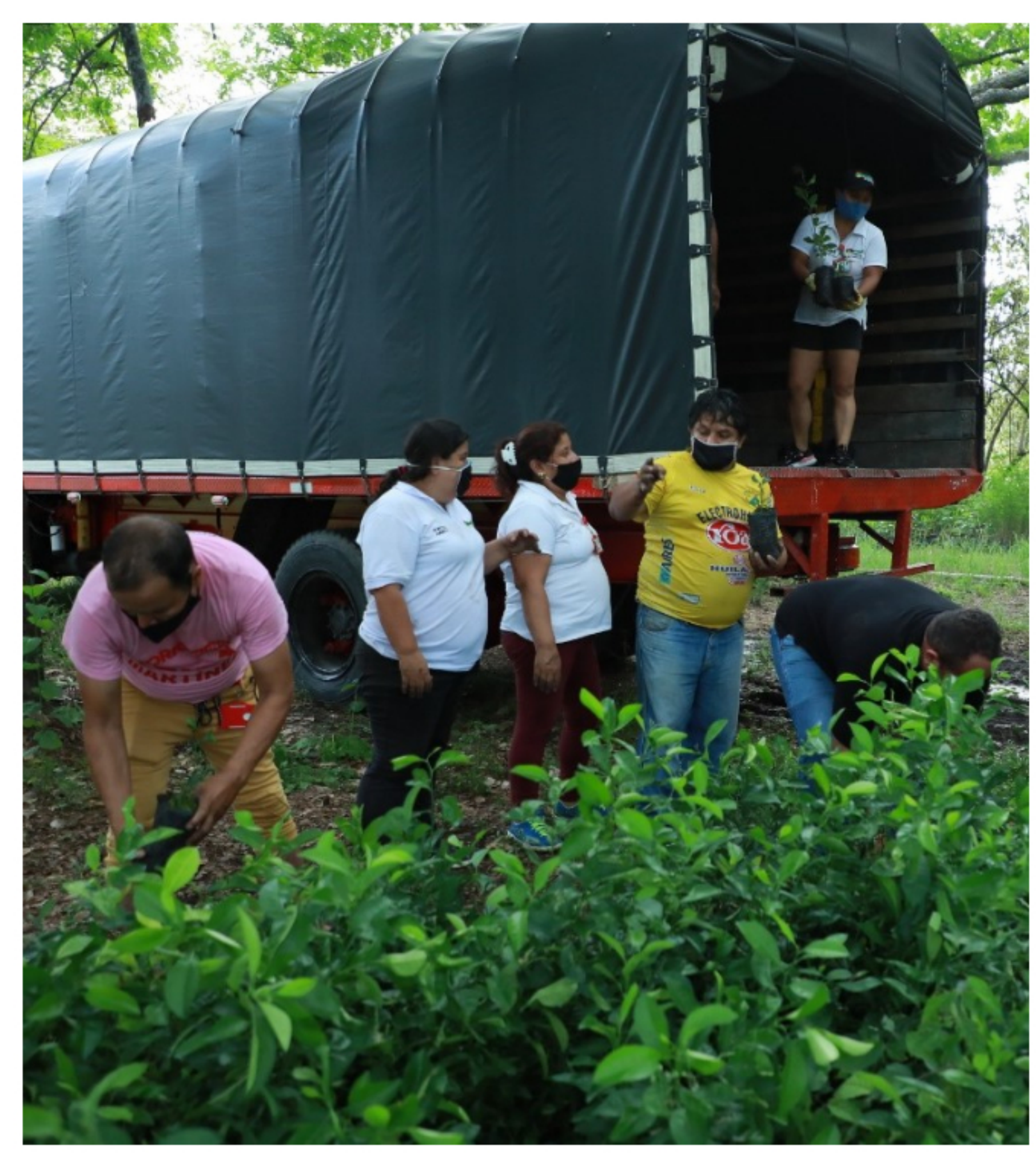
Las siembras se realizaron en las veredas Sardinata, Lagos del Rosario y Betania, y en el casco urbano de Palermo, siguiendo los más estrictos protocolos de bioseguridad para la prevención de la covid 19.

Así mismo, Ecopetrol entregó a la Alcaldía de Neiva 10 mil árboles de especies nativas de la región, que fueron sembrados en jornadas de reforestación en zonas rurales y urbanas del municipio, con el propósito de mejorar la calidad del aire, proteger las fuentes hídricas a través de la reforestación y generar un mejor ambiente para los neivanos.