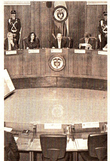
Corte Constitucional está revisando los decretos de las emergencias.