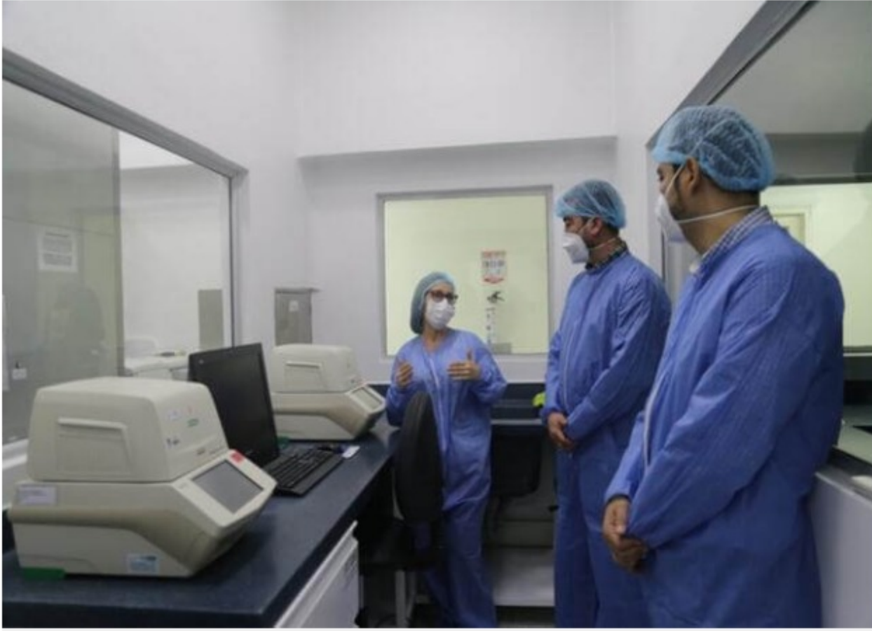
BLU Radio. Laboratorio ICA / Foto: Gobernación de Santander

Serán cinco los laboratorios que procesarán pruebas de coronavirus en este departamento.