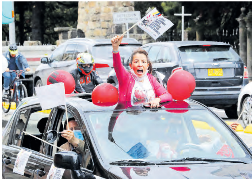
Los manifestantes piden mayor seguridad y se oponen al crédito para Avianca.

Con caravanas, las centrales obreras rechazaron la norma que creó el piso de protección social.