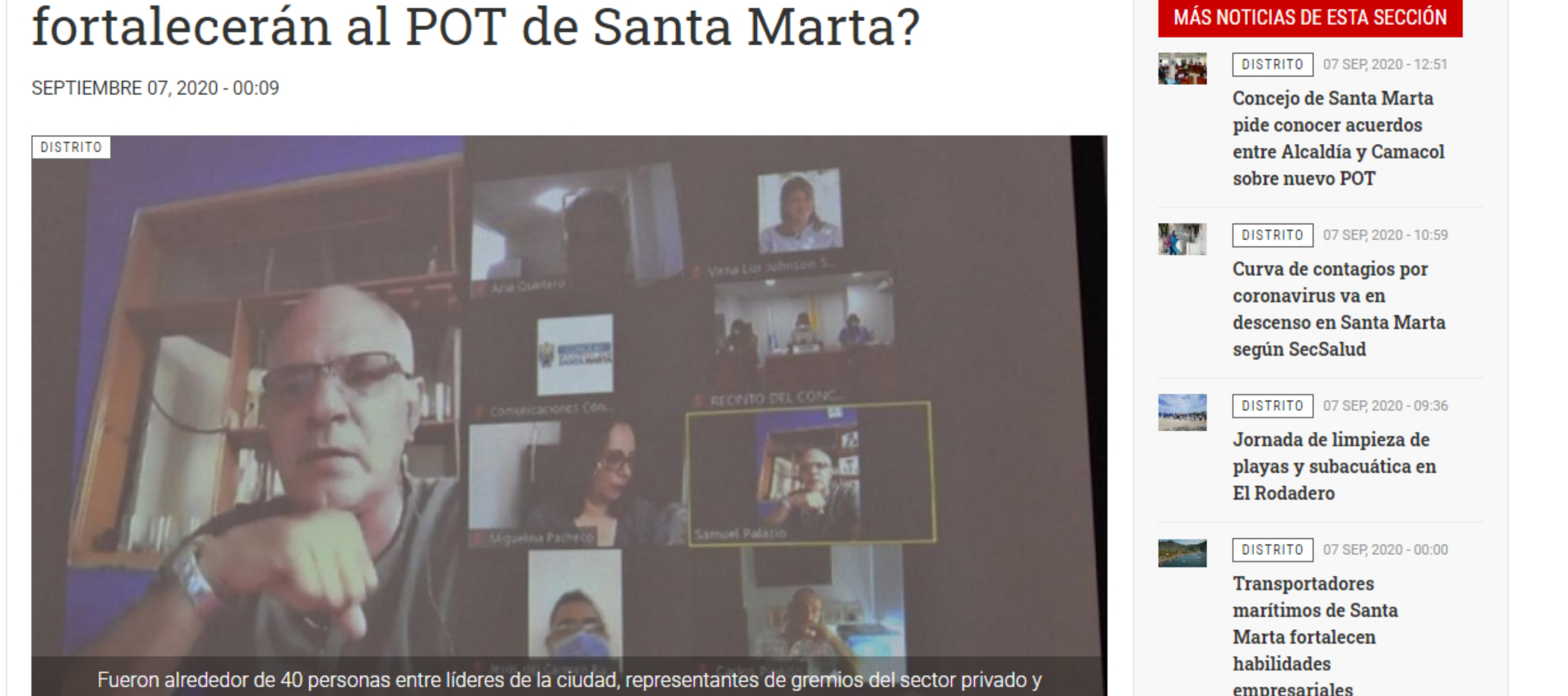
Fueron alrededor de 40 personas entre líderes de la ciudad, representantes de gremios del sector privado y ciudadanos quienes pudieron dejar sus opiniones, inquietudes y recomendaciones respecto al POT.

Hasta el 23 de septiembre el Concejo distrital deberá definir lo que será el Plan de Ordenamiento Territorial de Santa Marta, POT 500 Años y decidir si se llegarán a tener en cuenta los ajustes y precisiones hechos por los 40 intervinientes en las sesiones del 21,22 y 23 de julio del presente año.