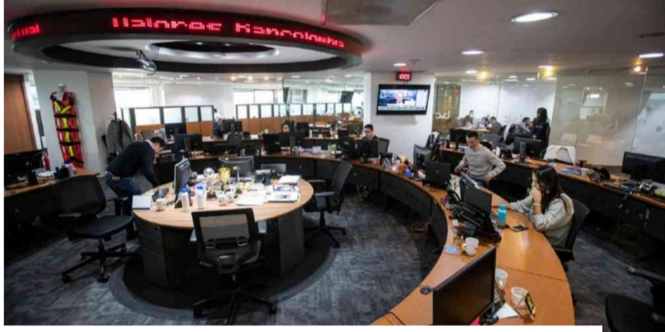
Los ganadores del premio de investigaciones económicas de la BVC

La Bolsa de Valores de Colombia comunicó que los ganadores del premio a las Áreas de Investigaciones Económicas fueron el Grupo Bancolombia, Banco Agrario, Corficolombiana e Itaú.