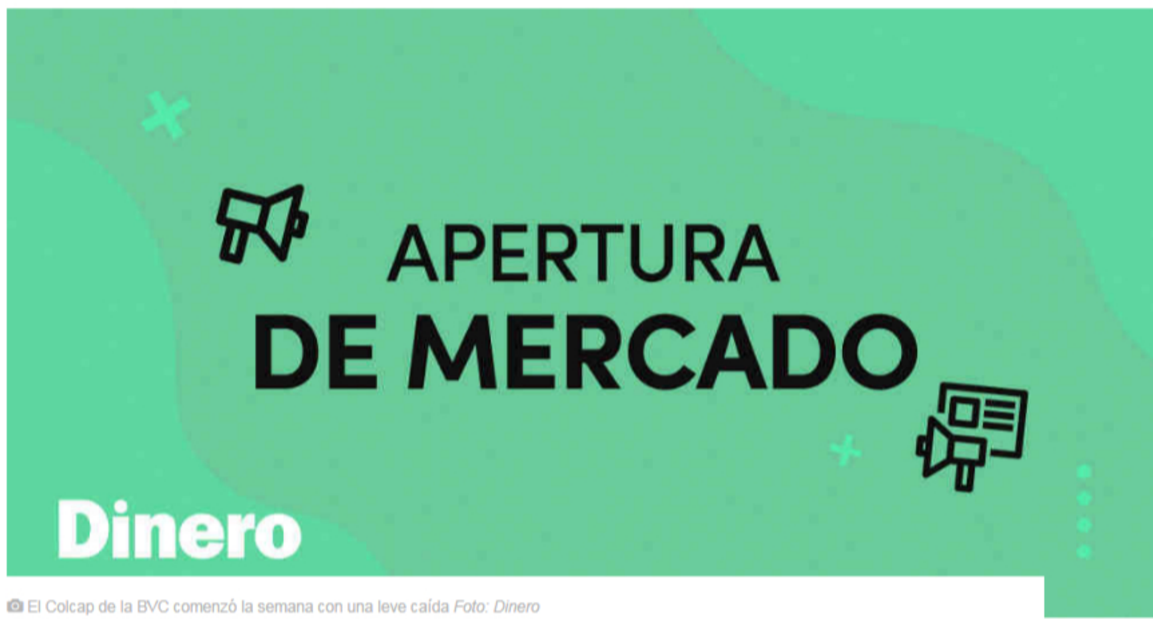
El Colcap de la BVC comenzó la semana con una leve caída

El índice Colcap de la Bolsa de Valores de Colombia comenzó la jornada con una caída del 0,9% a 1.239,12 unidades, arrastrado por Ecopetrol que perdía 0,7% a $2.130 y por Preferencial Grupo Aval con -0,21% a $948. En cambio, solo una acción inició el lunes con comportamiento positivo: la de Cemex Latam Holdings con un alza de 1,3% a $2.720. Al ser festivo en Estados Unidos, se espera que los montos negociados en la Bolsa de Valores nacional sean inferiores.