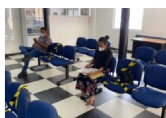
Dirección Territorial del IGAC en Atlántico reanuda atención presencial a los ciudadanos