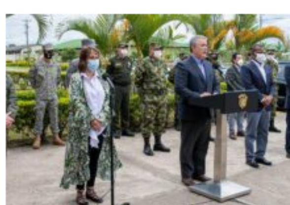
Presidente Duque anuncia que se reforzarán seguridad e inversión social en el departamento del Cauca