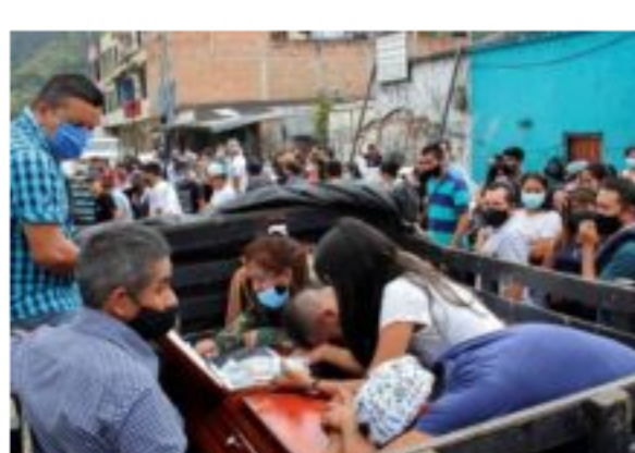
Tres masacres en las últimas horas en Colombia cobran 12 vidas