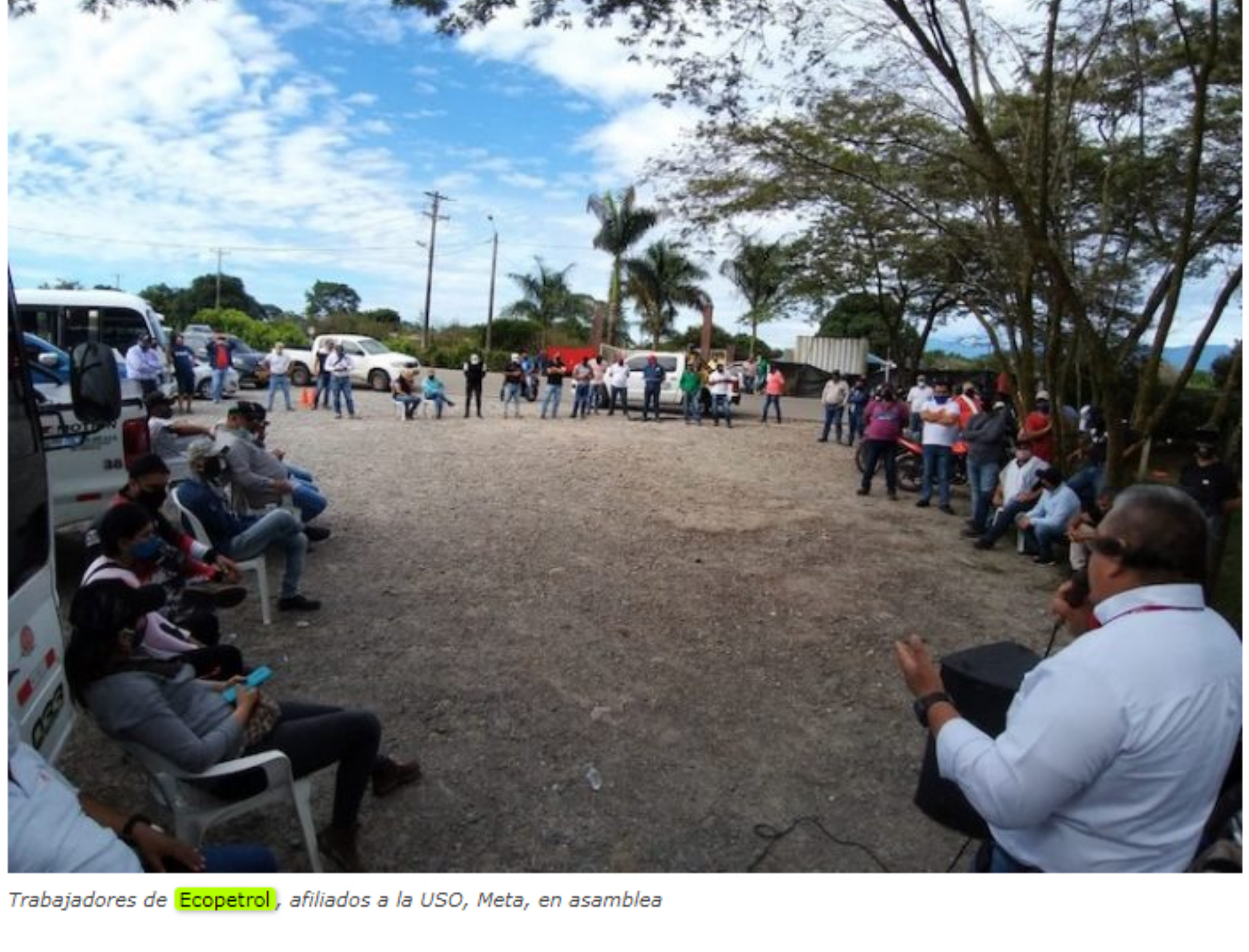
Trabajadores de Ecopetrol , afiliados a la USO, Meta, en asamblea

Compartir en Facebook Compartir en Twitter G+ P