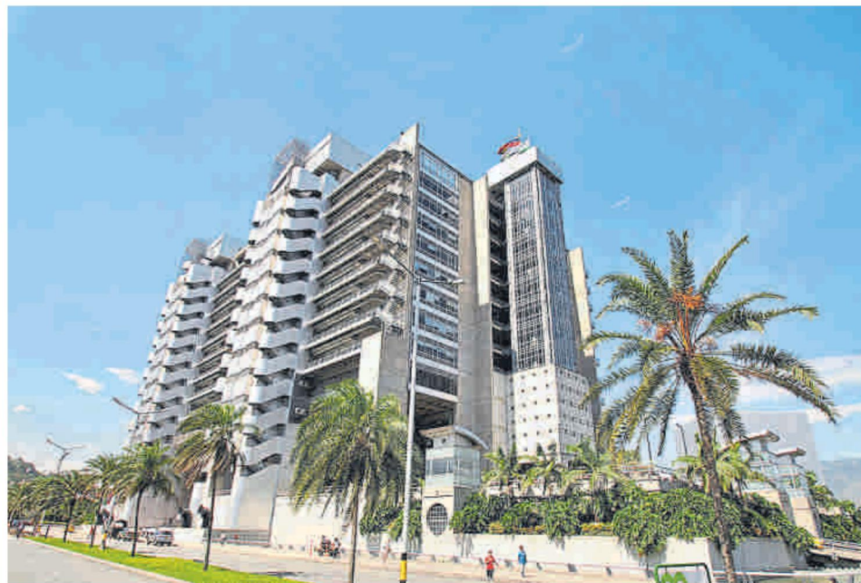
El nivel extra de las inversiones llevarían a EPM a no asumir el mercado de Caribe Mar. EPM

Al momento de la subasta (marzo pasado), el valor de las inversiones quedaron en poco más de $5 billones para cada uno. Pero, seis meses después y producto de las consecuencias por la pandemia (covid-19), los recursos requeridos por mercado estarían en $7,5 billones, y a la vuelta de cinco