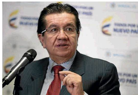
Ministerio de Salud

El Ministerio de Salud, liderado por Fernando Ruiz, señaló que los territorios deben definir los puntos para hacer paradas en carreteras.