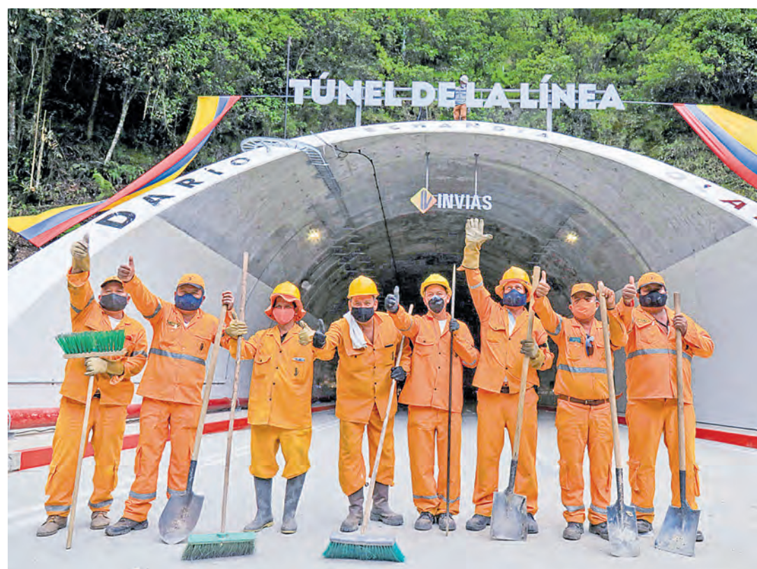
Con 8,65 km de longitud, es de los 20 túneles más largos de carretera del mundo.

Luego de más de un siglo de promesas de construcción, será entregada la megaobra principal que une al Tolima y el Quindío. Pág. 7