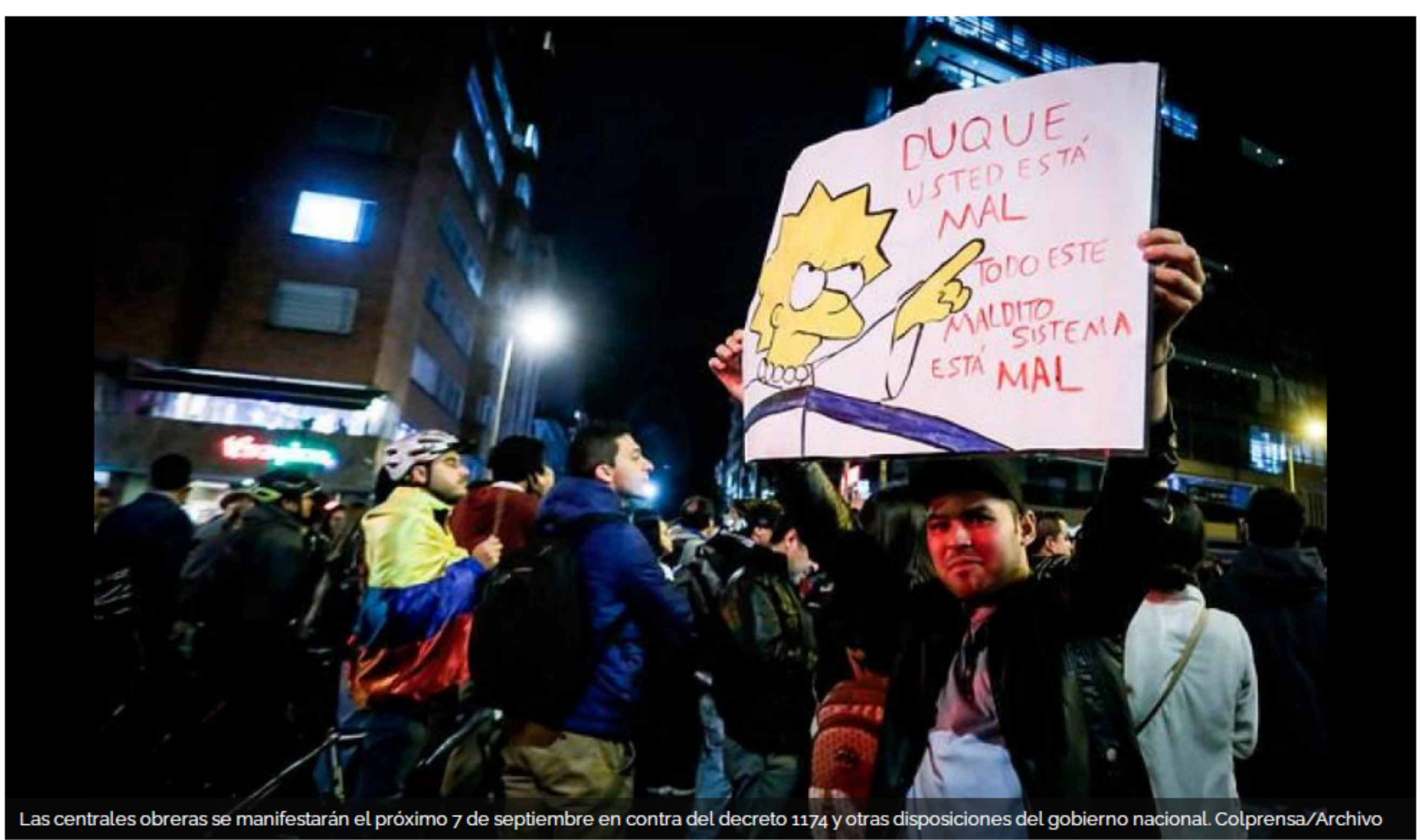
Las centrales obreras se manifestarán el próximo 7 de septiembre en contra del decreto 1174 y otras disposiciones del gobierno nacional.

Las centrales obreras, Fecode y las centrales de pensionados tildan el decreto 1174 de reforma laboral y pensional. Convocan a una caravana vehicular, el 7 de septiembre.