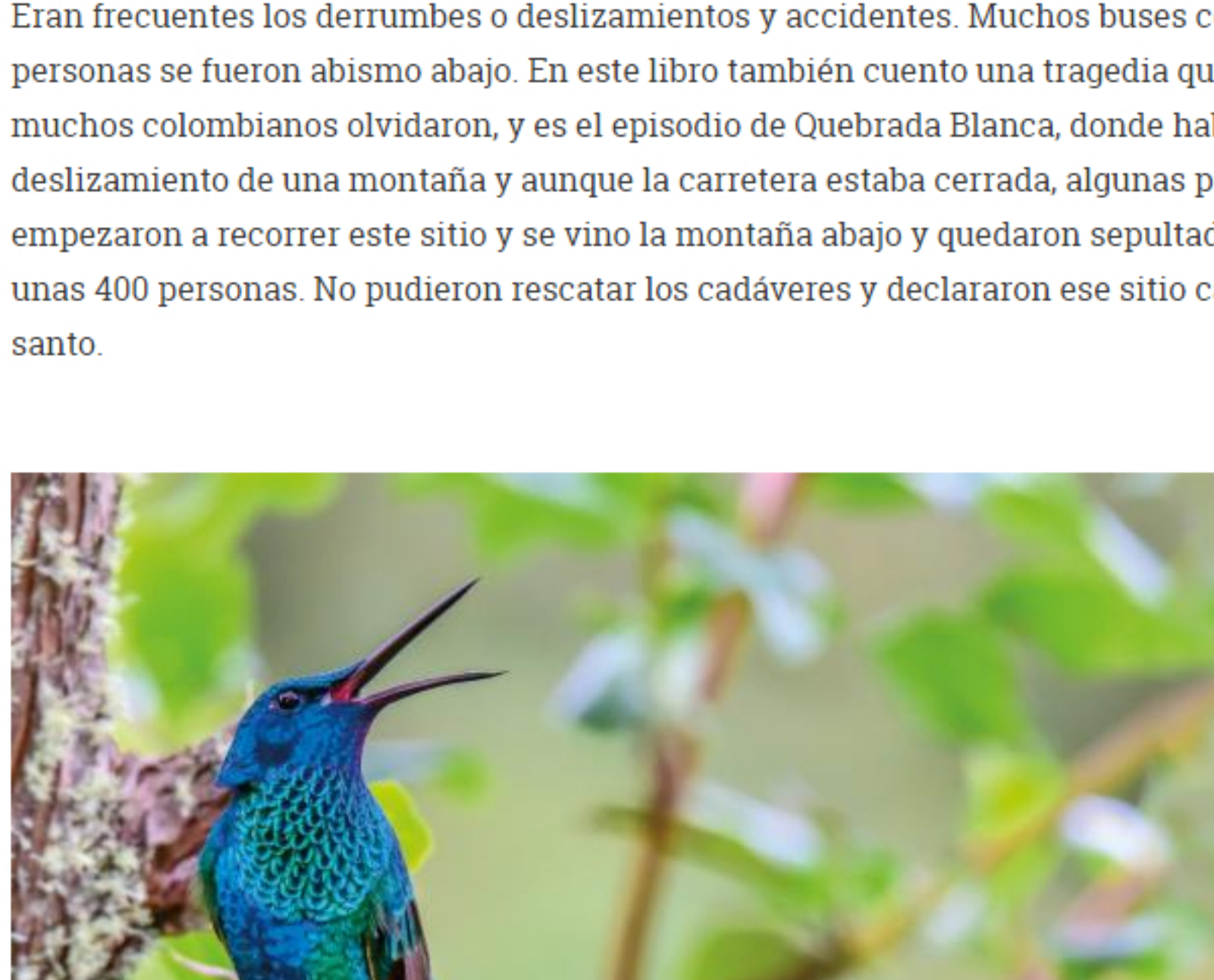
Un 'colibrí corsucans'. En el libro, 'Colombia: encuentros con su biodiversidad', las protagonistas son las aves.

Eran frecuentes los derrumbes o deslizamientos y accidentes. Muchos buses con personas se fueron abismo abajo. Y es este libro también cuento una tragedia que ya muchos colombianos olvidaron, en el episodio de Quebrada Blanca, donde había un deslizamiento de una montaña y aunque la carretera estaba cerrada, algunas personas empezaron a recorrer este sitio y se vino la montaña abajo y quedaron sepultadas unas 400 personas. No pudieron rescatar los cadáveres y declararon ese sitio campo santo.