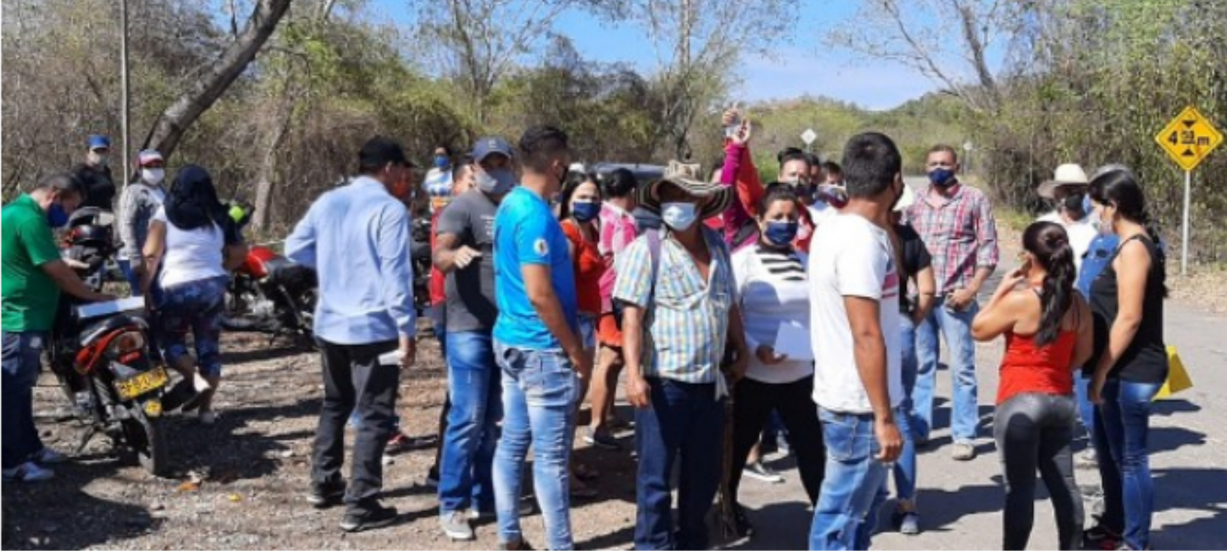
Desde hace una semana se han venido presentando unas manifestaciones de nueve comunidades del norte del Huila del área petrolera.

Luego de una semana de manifestaciones la Unión Sindical Obrera 'USO pide que se cree una comisión de alto nivel con la capacidad de negociación sin necesidad del uso de la fuerza pública por la vía del diálogo para sacar adelante este conflicto de manera humanitaria. "Necesitamos solucionar esto pacíficamente, sin el uso de la fuerza pública", igualmente señalaron voceros de las comunidades.