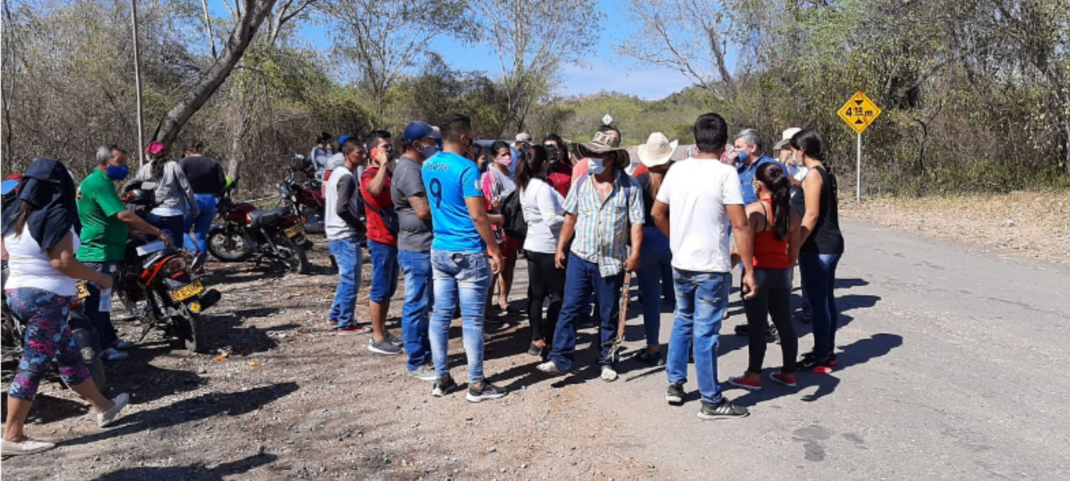
Desde ayer están en dos puntos, uno es La Batería Terciaria y el otro en la entrada de Palogrande cerca de la zona industrial de Ecopetrol en Campo Dina.