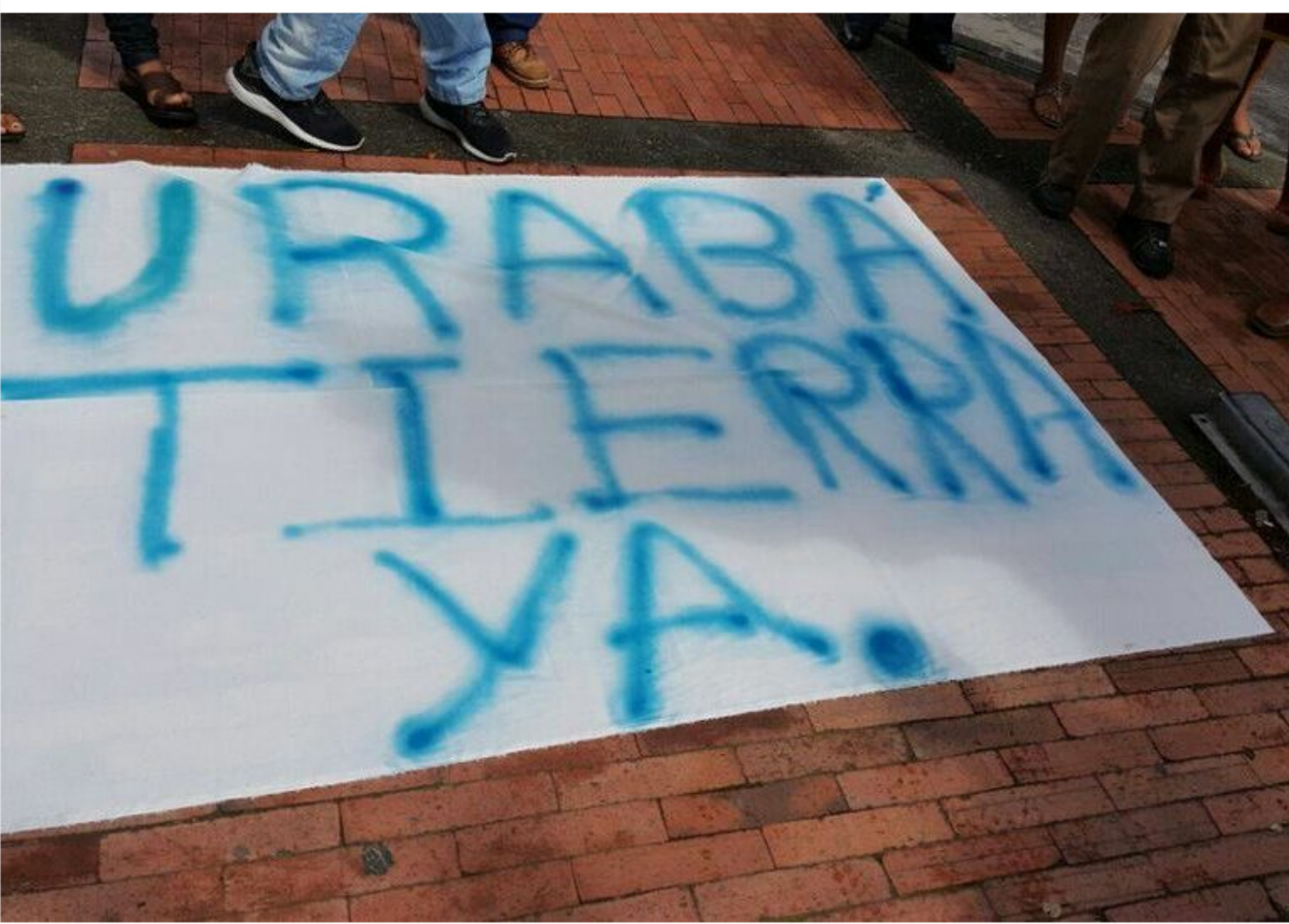
Foto: subregión Urabá entre Antioquia, Córdoba, Chocó/ Forjando Futuros

Contagio Radio septiembre 3, 2020 at 7:03 pm