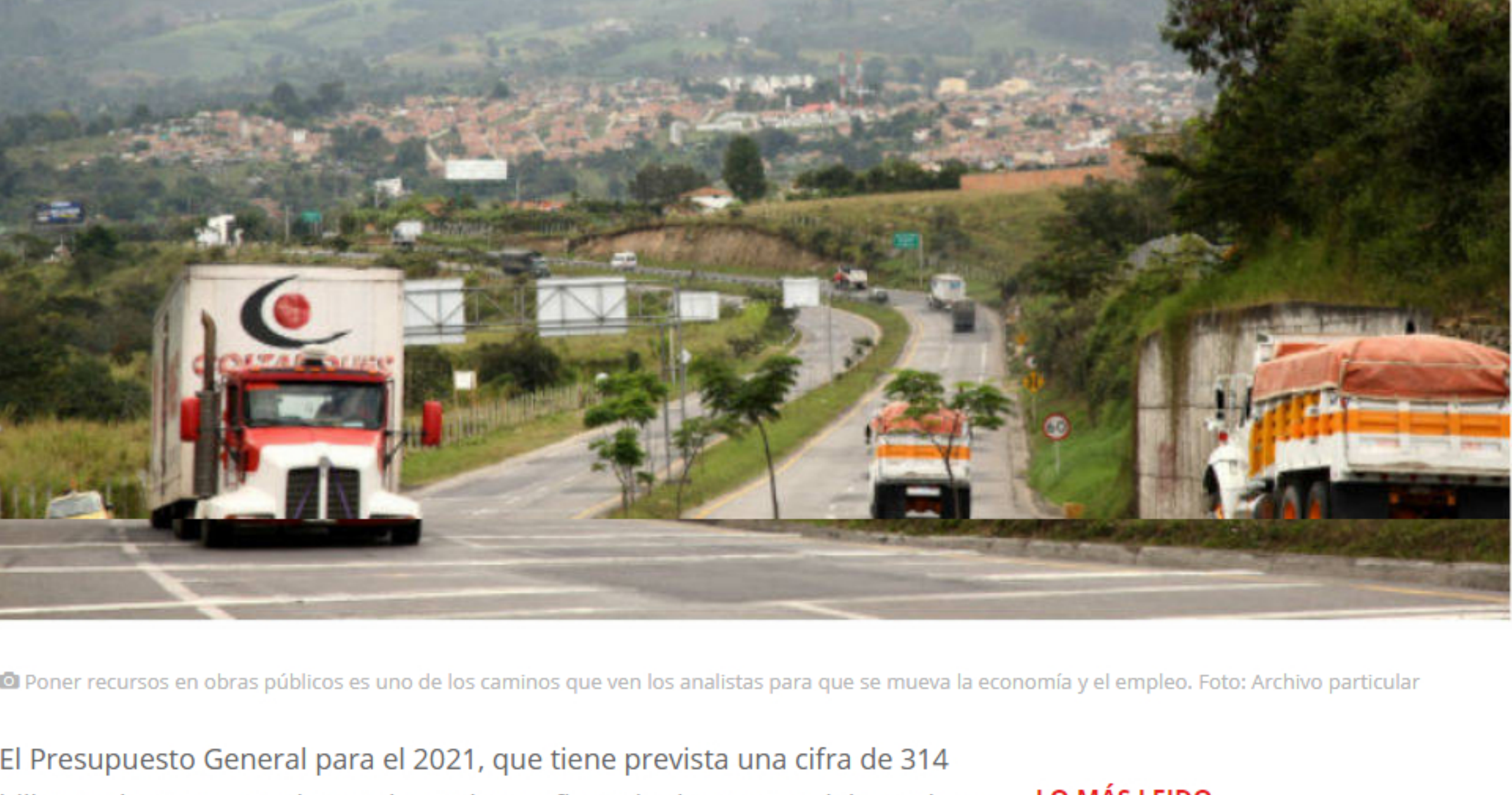
☞ Poner recursos en obras públicas es uno de los caminos que ven los analistas para que se mueva la economía y el empleo.

El Centro Democrático presentó una constancia en la que respaldan la propuesta de Presupuesto para el próximo año. Crean oportuno vender la parte de Ecopetrol que está autorizada, pero elevaron otras dudas.