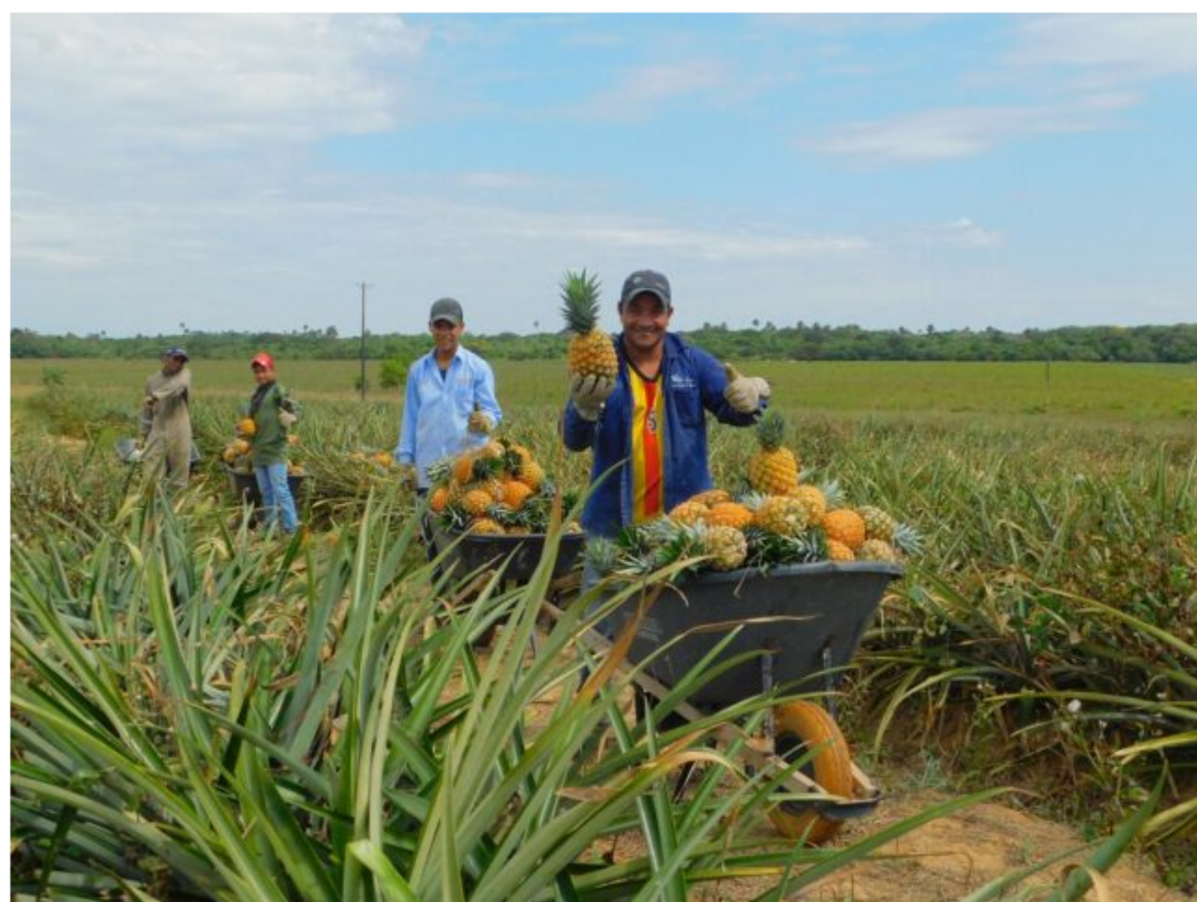
120 productores de piña en el municipio de Tauramena, serán beneficiados en la estrategia tecnológica, organización y comercial, en cooperación con la Cámara de Comercio de Casanare, y en articulación con la Alcaldía.