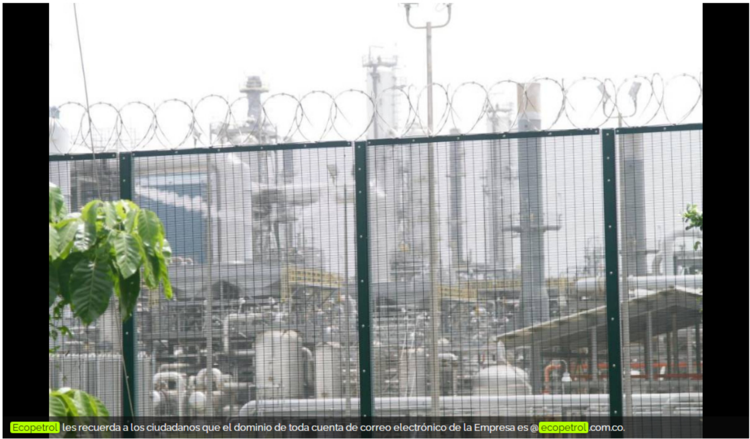
Ecopetrol les recuerda a los ciudadanos que el dominio de toda cuenta de correo electrónico de la Empresa es @ecopetrol.com.co .

La empresa indica que personas inescrupulosas están usando su nombre para falsas convocatorias laborales y piden dinero a cambio de ciertos beneficios.