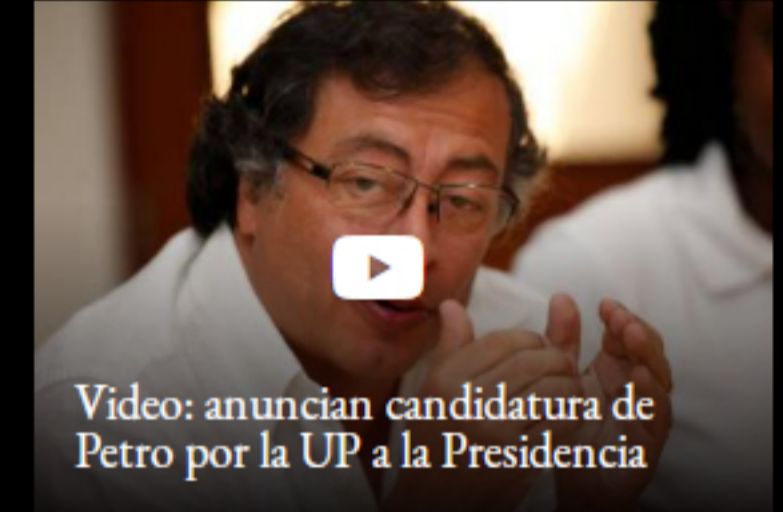
Video: anuncian candidatura de Petro por la UP a la Presidencia