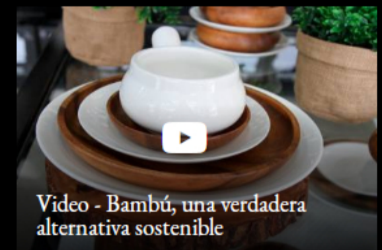
Video - Bambú, una verdadera alternativa sostenible