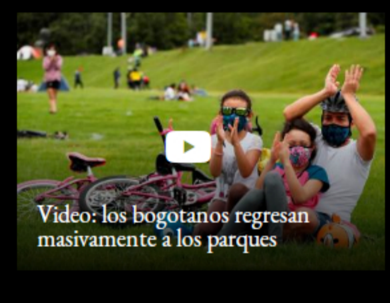
Video: los bogotanos regresan masivamente a los parques