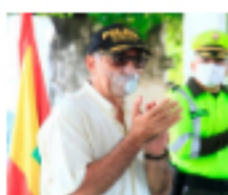
"Cartagena será la primera ciudad con vuelos internacionales": Dau