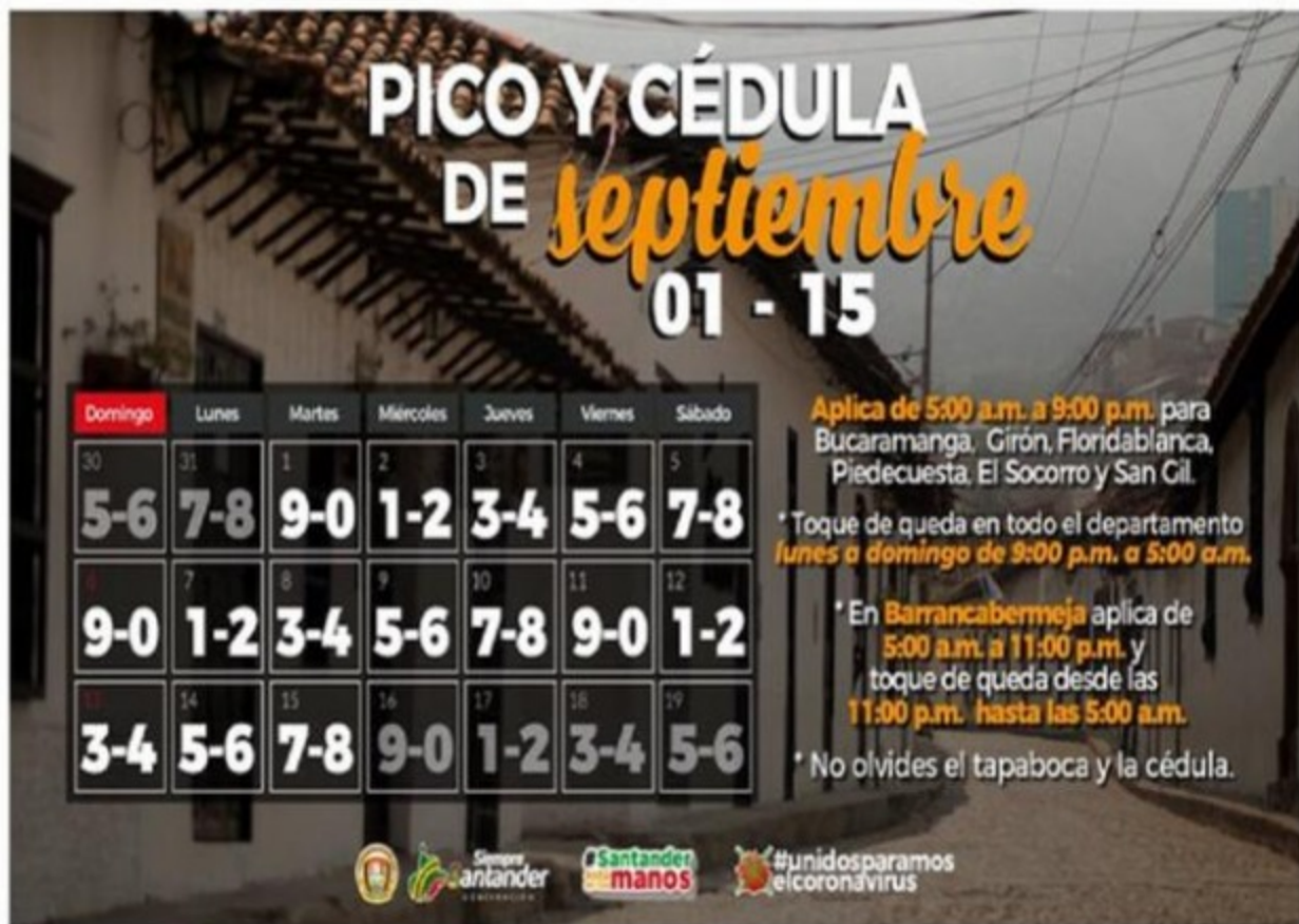
BLU Radio. Pico y Cédula Bucaramanga

El pico y cédula en Bucaramanga y Santander continuará siendo de dos dígitos diarios durante septiembre.