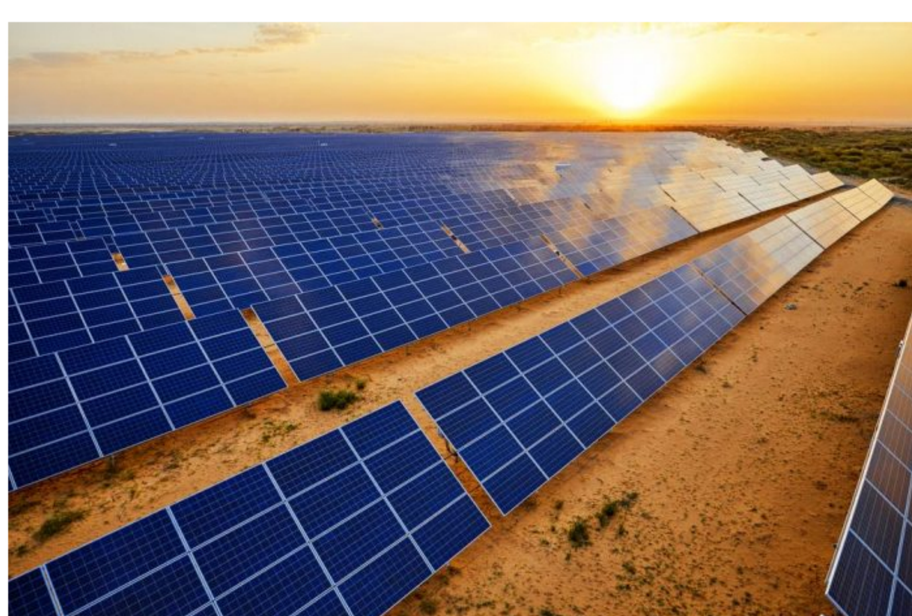
Paneles solares en el desierto.

La Guajira es el departamento con mayor potencial en irradiación solar en Colombia. De hecho, es uno de los lugares con uno de los potenciales mayores de energía solar en el mundo, con 42.000 MW.