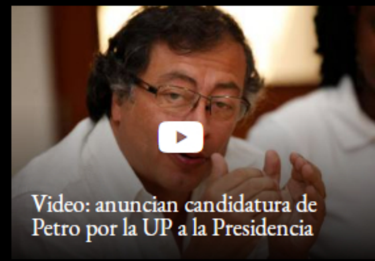
Video: anuncian candidatura de Petro por la UP a la Presidencia