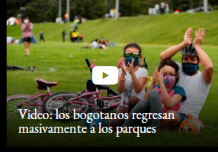
Video: los bogotanos regresan masivamente a los parques