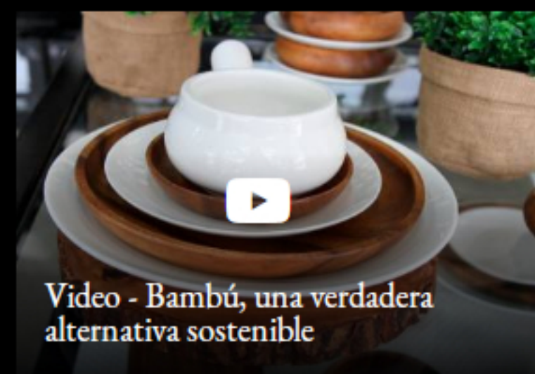
Video - Bambú, una verdadera alternativa sostenible