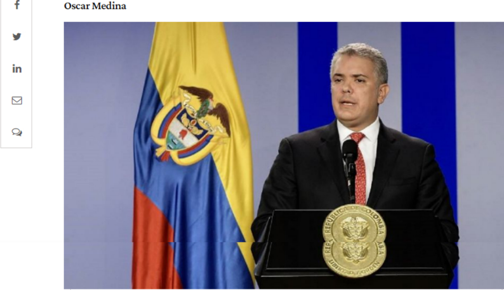
Ivan Duque, presidente de Colombia