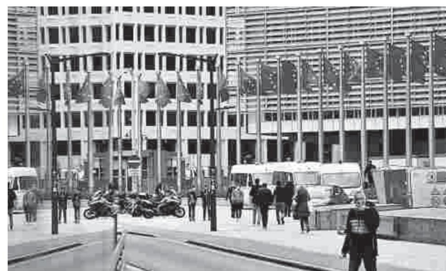
Sede de la Unión Europea en Bruselas.

La presidenta de la Comisión Europea, Ursula von der Leyen, afirmó que sus negociadores viajarían a Londres la próxima semana como estaba previsto. Pero un portavoz de Dow-