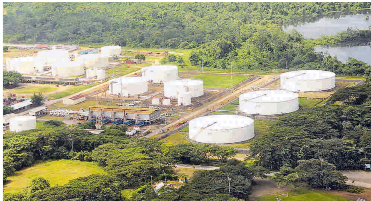
Campo petrolero de Caño Limón, que recientemente fue vendido por parte de la Occidental al Carlyle Group.

En cuanto a Venture Capital (capital de riesgo o capital emprendedor), se han realizado 401 transacciones, de las cuales 278 operaciones tienen un valor no confidencial que suman al-