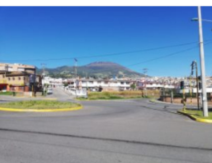
La soledad de Pasto en medio de la emergencia marzo 22, 2020