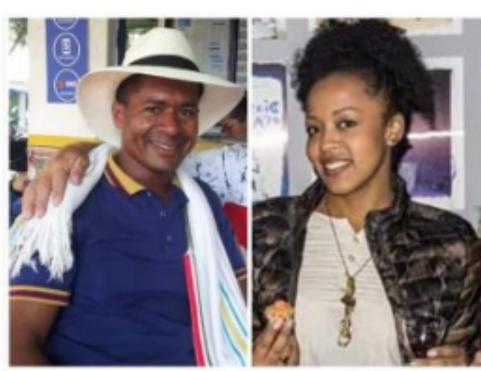
Nariño llora el asesinato de dos líderes sociales diciembre 27, 2019