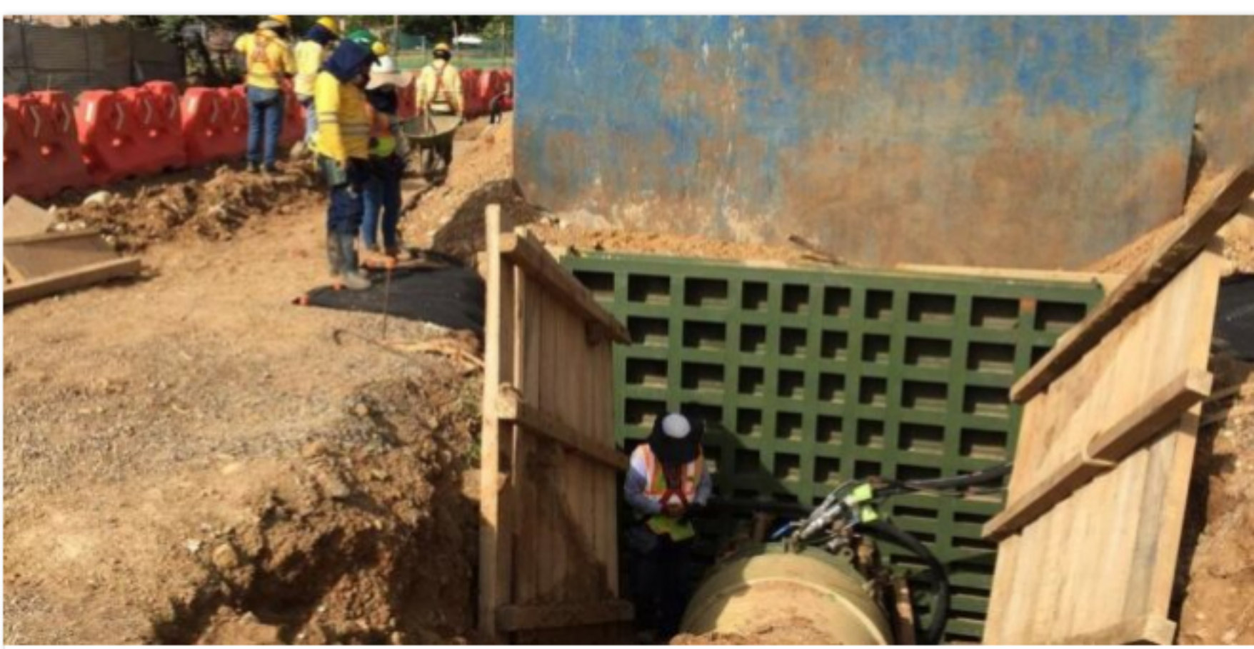
La obra avanza en el 38,4 %, con labores en nueve frentes de trabajo de manera simultánea. Esta es la primera prueba de cerca de 40 que se harán en la ejecución de las obras.

Inicio / Destacado Barra / ACUEDUCTO METROPOLITANO. Exitosa prueba hidrostática del subproyecto 1