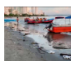
Playas de Castillogrande, atestadas de basuras

En las jornadas se han venido sembrando más de 30 especies nativas entre las cuales se destacan el Caracolí, Flor Amarillo, Cedro, Guayacán, Guamo y árboles frutales.