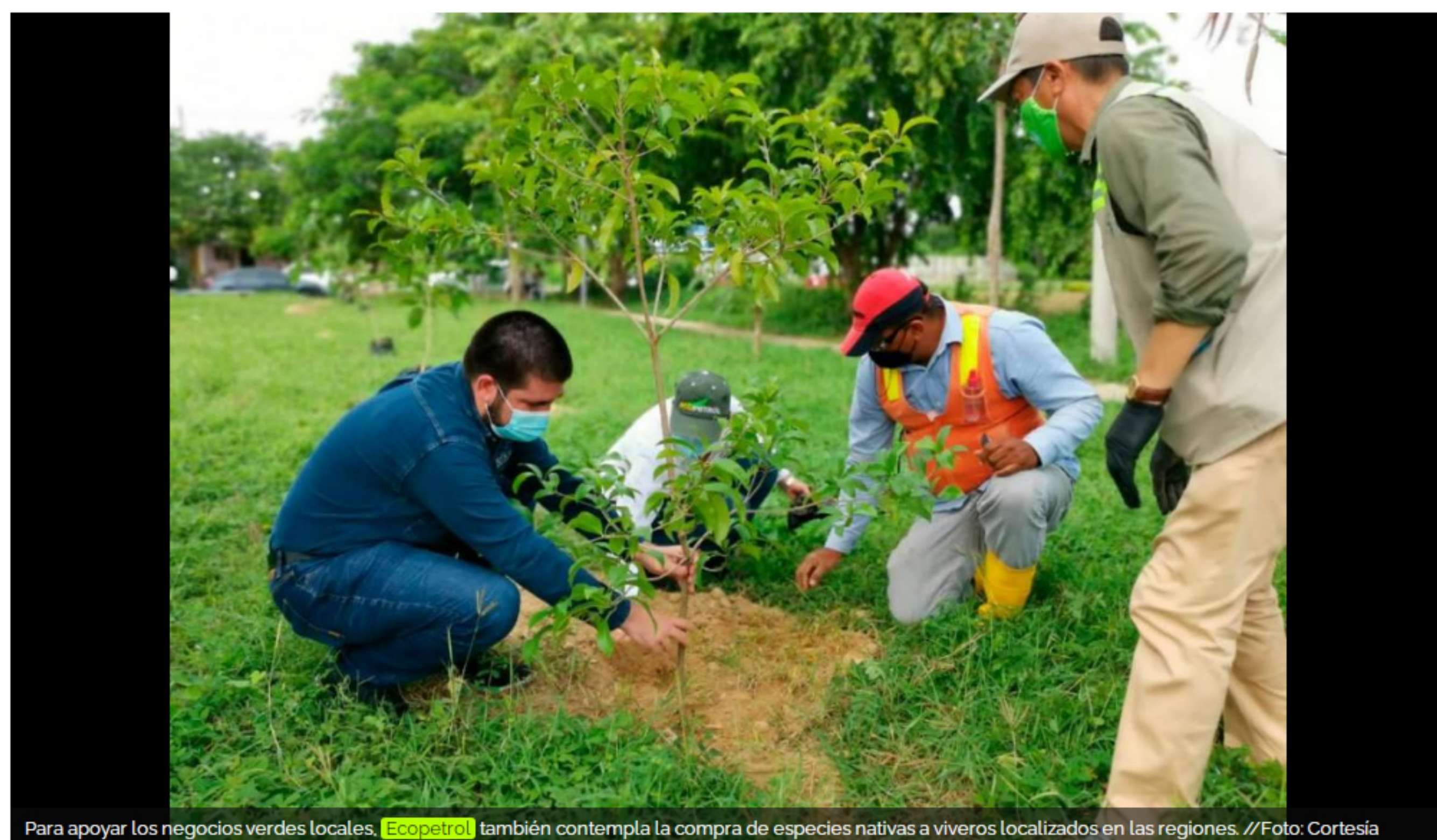
Para apoyar los negocios verdes locales, Ecopetrol también contempla la compra de especies nativas a viveros localizados en las regiones.

Ecopetrol lidera esta loable iniciativa que busca mejorar el medio ambiente del país y amortiguar de cierto modo el cambio climático.