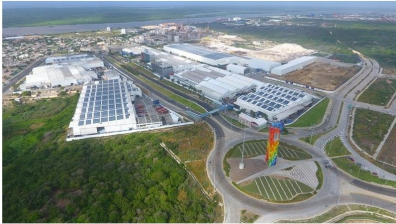
Panorámica de Tecnoglass en Barranquilla.

La acción listada en la Bolsa de Nueva York tuvo el alza más importante dentro de las compañías que también cotizan en la bolsa colombiana.