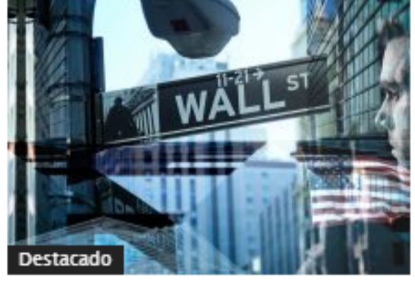
Wall Street terminó sesión al alza por impulso de tecnológicas