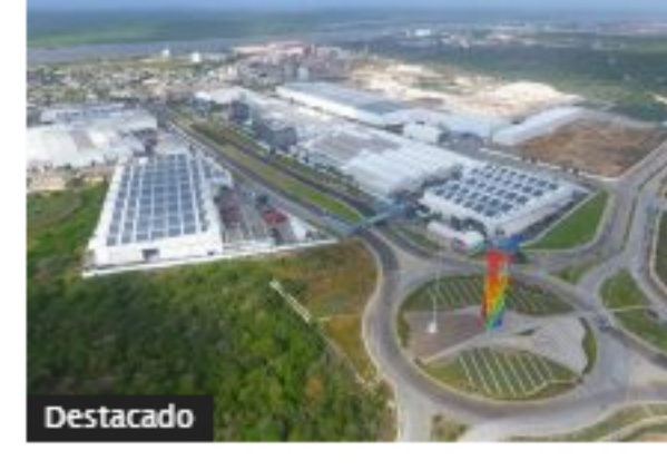
Tecnoglass lideró las ganancias de acciones colombianas en Wall Street