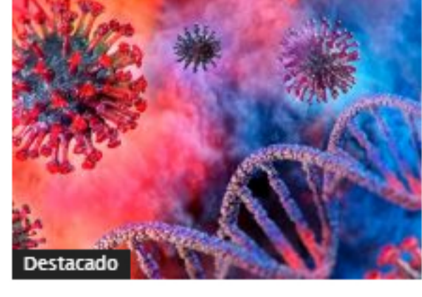
Colombia presentó leve descenso en casos activos de coronavirus