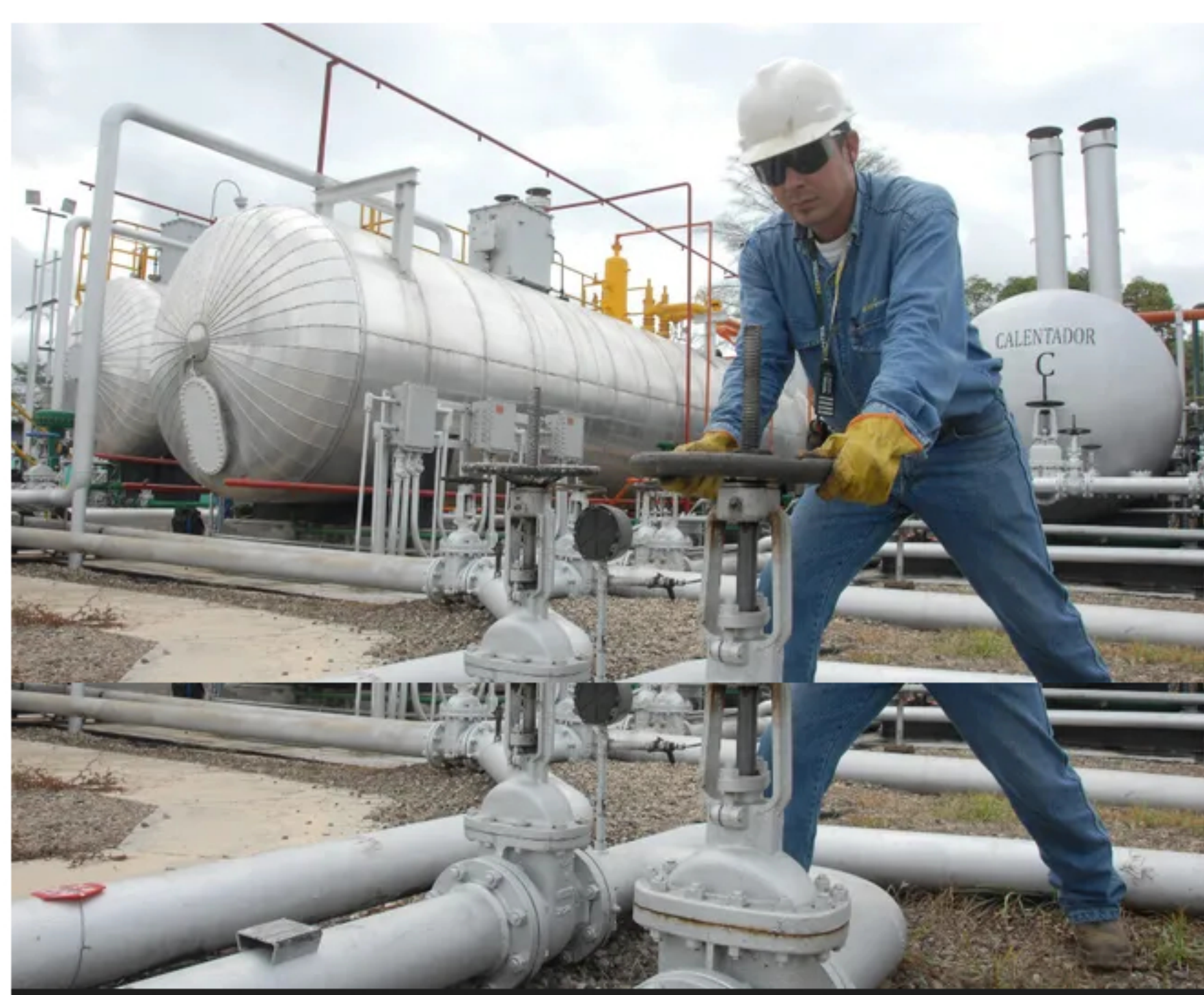
El mercado mayorista de gas natural tiene a Ecopetrol como actor dominante monopólico, advierte Aciem.

Ajustar la estructura del sector con miras a lograr un equilibrio del mercado, teniendo en cuenta las necesidades de la demanda, con factores de eficiencia, competitividad, flexibilidad, calidad y una menor concentración de la oferta, son las propuestas de la Asociación Colombiana de Ingenieros (ACIEM).