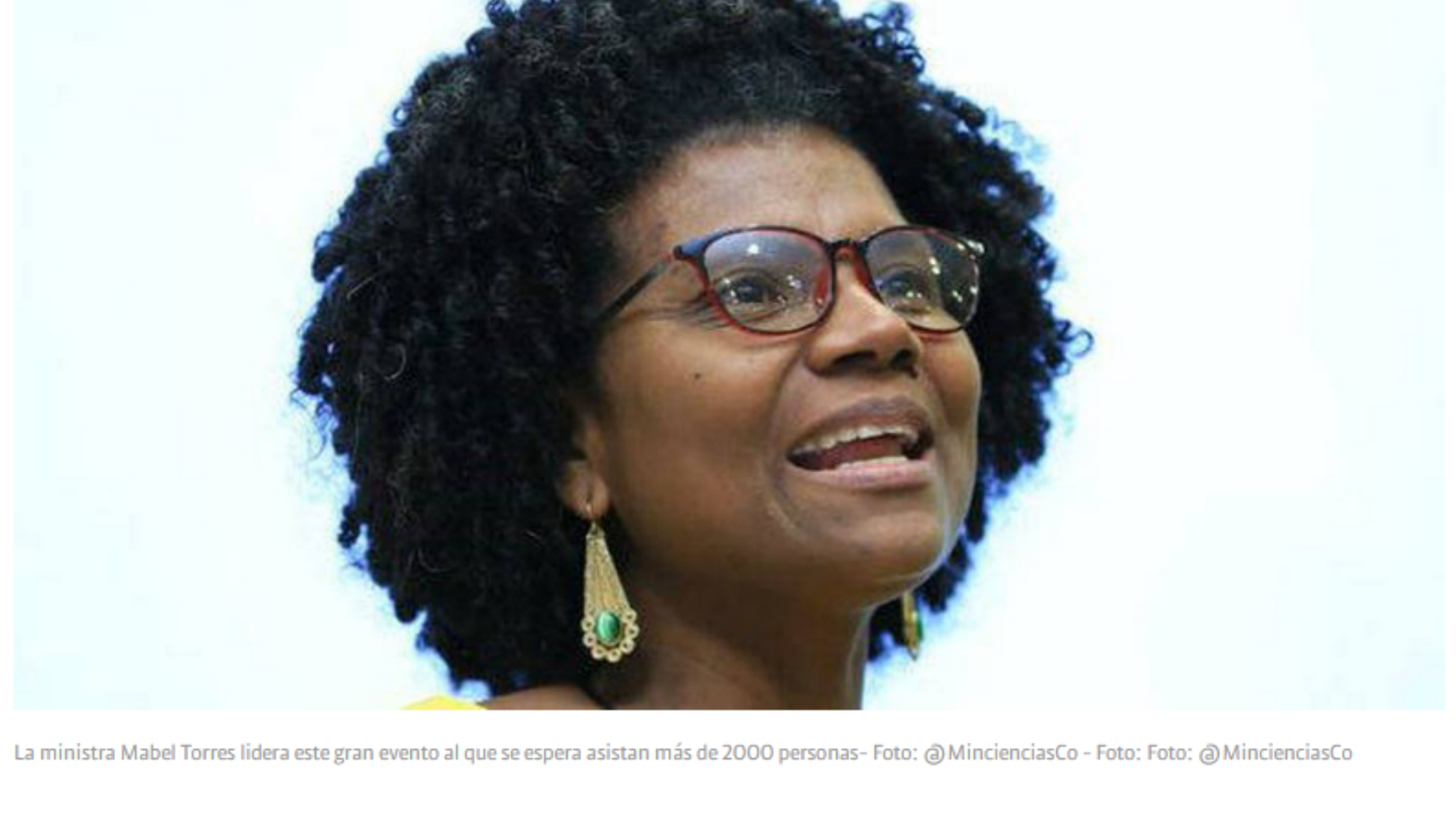
La ministra Mabel Torres lidera este gran evento al que se espera asistan más de 2000 personas

Suscríbete por 1.000 pesos al mes Ver oferta