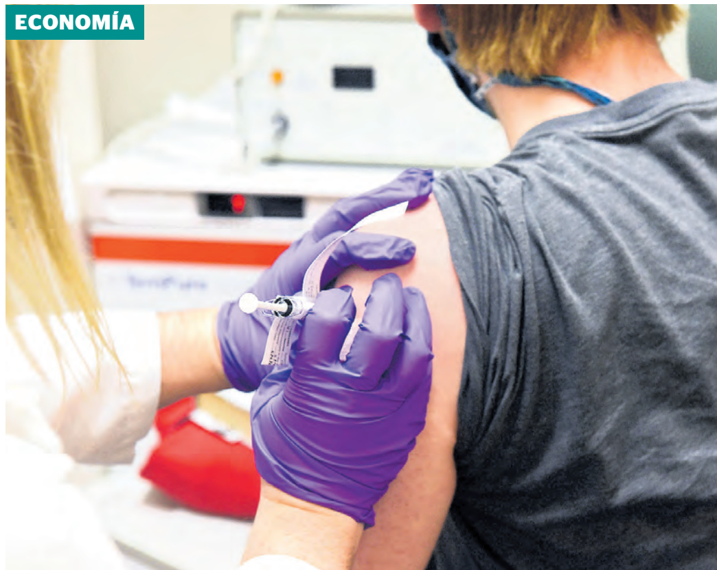
En la primera fase se vacunará a empleados de salud, mayores de 60 años y personas con morbilidades.