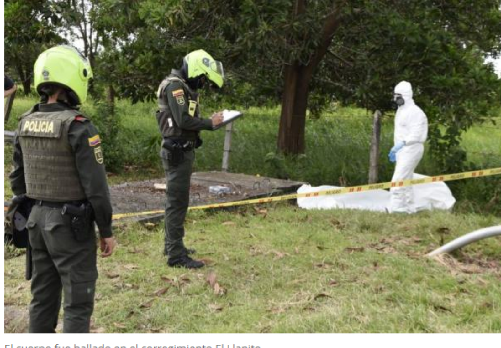
El cuerpo fue hallado en el corregimiento El Llanito.

La Fiscalía notificó a Ecopetrol sobre esta orden de captura y le solicitó información personal de su trabajo para poder hacer efectiva esta orden de captura por el delito de feminicidio.