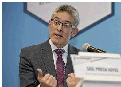
Twitter: Saúl Pineda Hoyos

El viceministro de desarrollo empresarial, Saúl Pineda , realizó varios anuncios en el marco de la estrategia 'Compromiso por Colombia', en la que se destacó que habrá una nueva línea especial de redescuento para microempresas, a través de Bancóldex . Tendrá un cupo de $78.000 millones, a un plazo de tres años. Además, habrá una línea de garantías para reestructuración de créditos por $500.000 millones. (AMS)