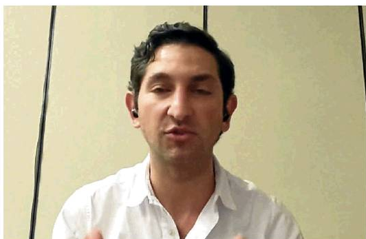
Ministerio de Minas