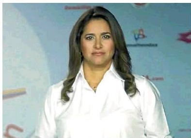
Presidencia de la República

La presidencia de la República informó que la primera dama, María Juliana Ruiz , se realizó la prueba de covid-19 la cual arrojó un resultado positivo. No obstante, el cuadro de salud de ella es satisfactorio, no presenta síntomas e informaron que ya está siguiendo los protocolos de aislamiento establecidos. Ante la cercanía con el presidente Duque , este se hizo la prueba, la cual resultó negativa. (AMS)