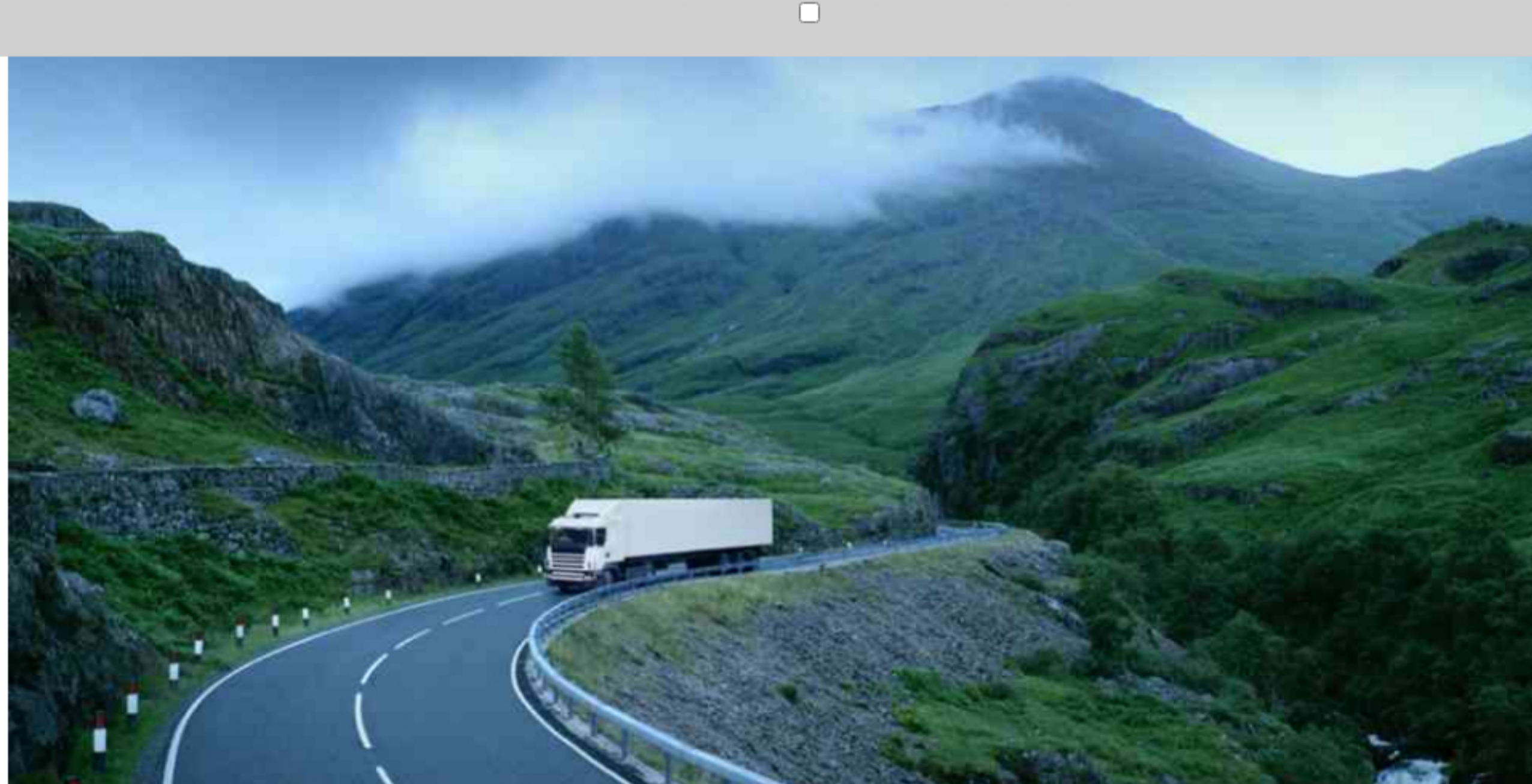
Inauguran la primera electrolinera rápida para camiones eléctricos de carga