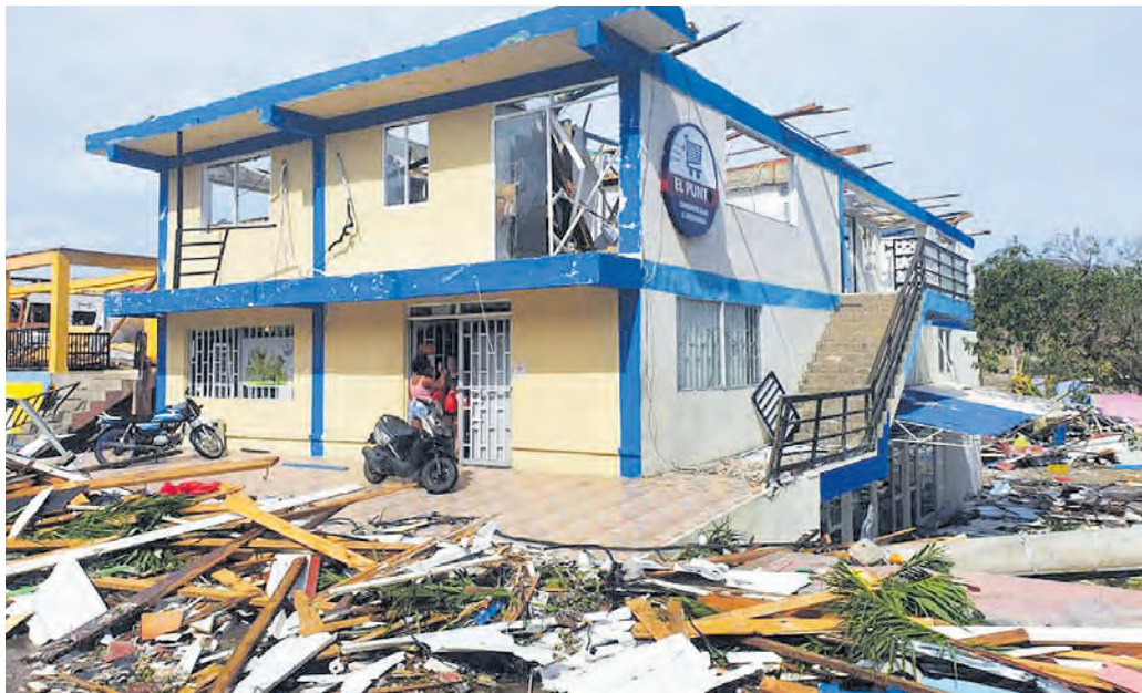
Este supermercado de Providencia es una muestra de los daños ocasionados en la isla.