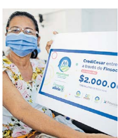
Emprendedora beneficiada del crédito.

Junto con Cesar, Finsocial suma un total de tres departamentos de cobertura de crédito (Atlántico y Córdoba) y planea “llegar a muchos más en el cercano 2021”.