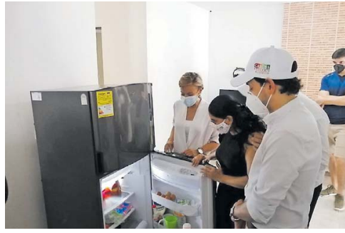
El ministro de Minas, Diego Mesa, durante un evento.

El censo para la población beneficiada se realizará desde el próximo miércoles 18 de noviem-