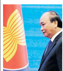
Nguyen Xuan Phuc, primer ministro de Vietnam.

La ASEAN está formada por Birmania (Myanmar), Brunéi, Camboya, Filipinas, Indonesia, Laos, Malasia, Singapur, Tailandia y Vietnam, que este año asumió la presidencia rotatoria del bloque. EFE