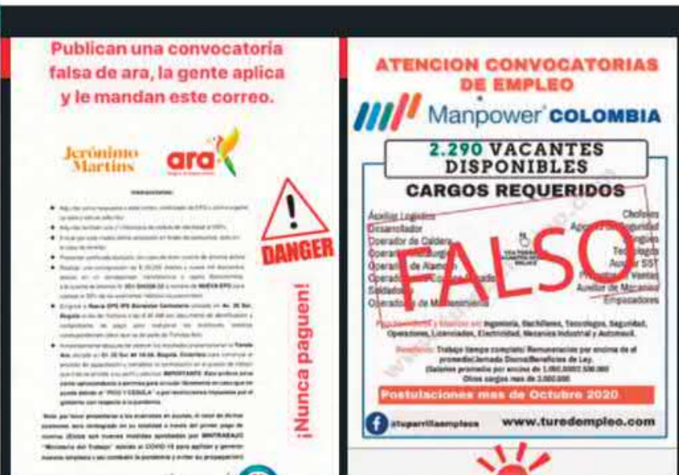
Mediante canales digitales, los delincuentes sacan provecho de la necesidad de empleo y dinero de las personas.