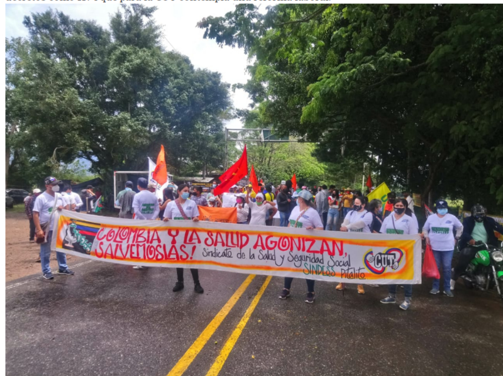
Los objetivos de esta convocatoria giran en torno a exigir democracia, a exigir paz, al cumplimiento de los acuerdos de paz con las FARC.

El pliego de peticiones trata un incremento del salario mínimo, matrícula cero y la eliminación de decretos como 1174 que para la CUT contempla una reforma laboral.