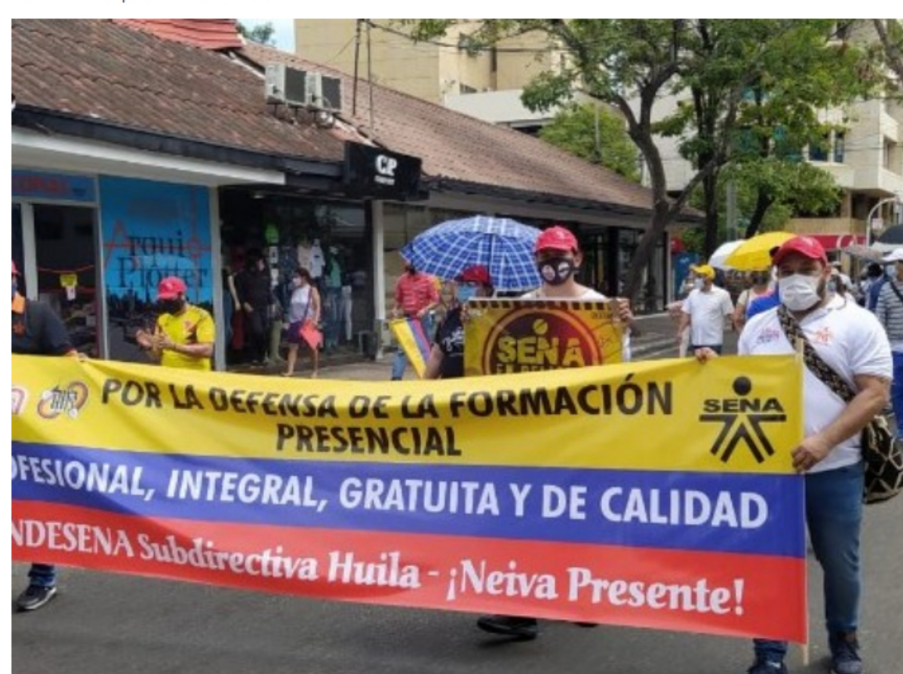
La Central Unitaria de Trabajadores de Colombia recordó que el próximo jueves 19 de noviembre se realizará un Paro Nacional.

Es la primera de las tres movilizaciones y protestas que se tienen programadas para el mes de noviembre y estará encabezada por el sector salud.