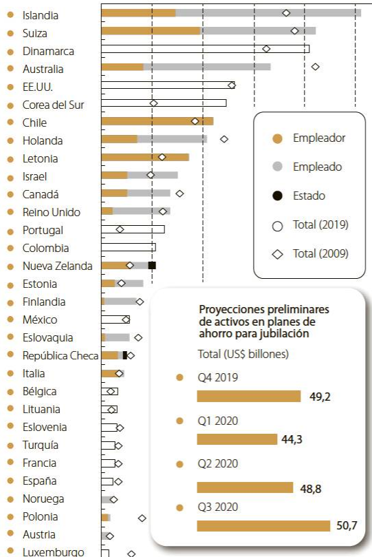
Proyecciones preliminares de activos en planes de ahorro para jubilación