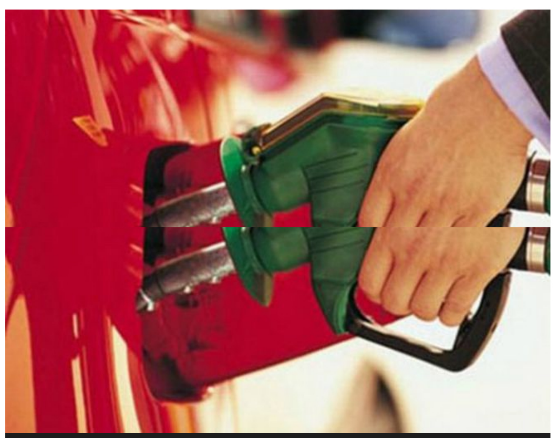
Ecopetrol respondió a la Contraloría que distribuye combustible de calidad internacional

Ante la advertencia de la Contraloría General sobre la calidad al futuro de los combustibles que se procesan en las refinerías de Cartagena y Barrancabermeja, Ecopetrol respondió que actualmente distribuye combustibles de calidad internacional a todos los colombianos.