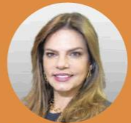
Flavia Santoro Presidenta de ProColombia