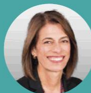
Rosario Córdoba Presidenta Consejo privado de competitividad