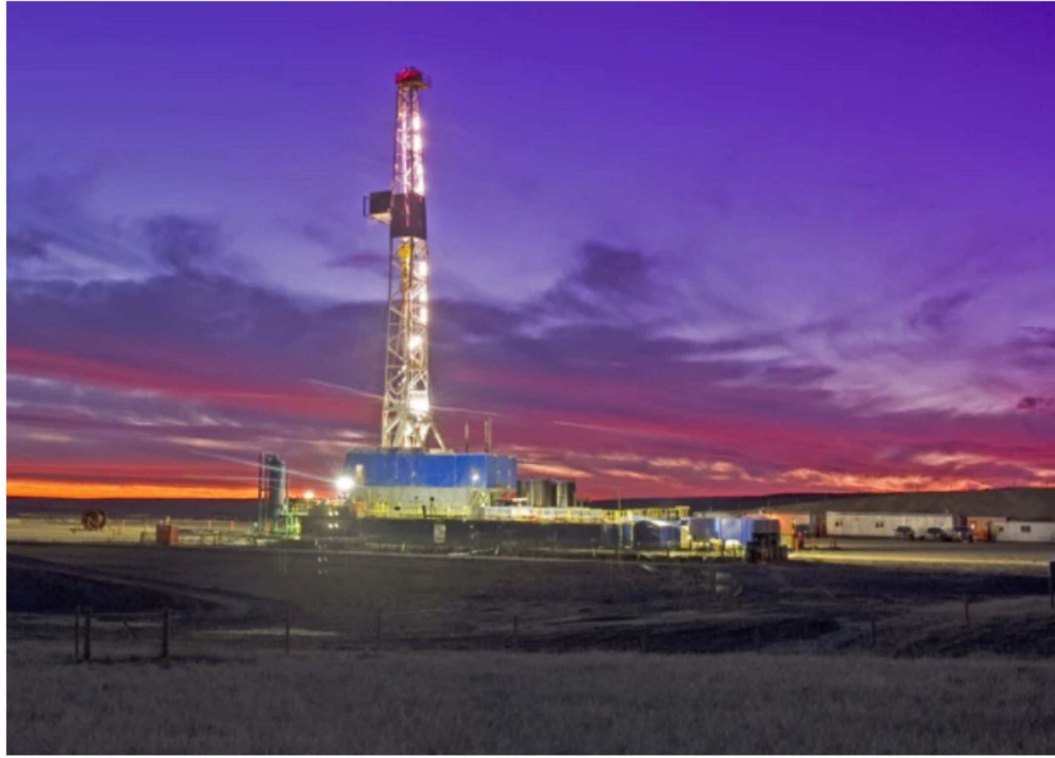
Blu Radio // Fracking // Foto: Congressional Western Caucus

Ambientalistas de Santander respaldaron la posición de la Procuraduría cuando manifiesta que el fracking no es compatible con el principio de desarrollo sostenible y solicita nulidad para dos decretos que le darían vía libre en Colombia.