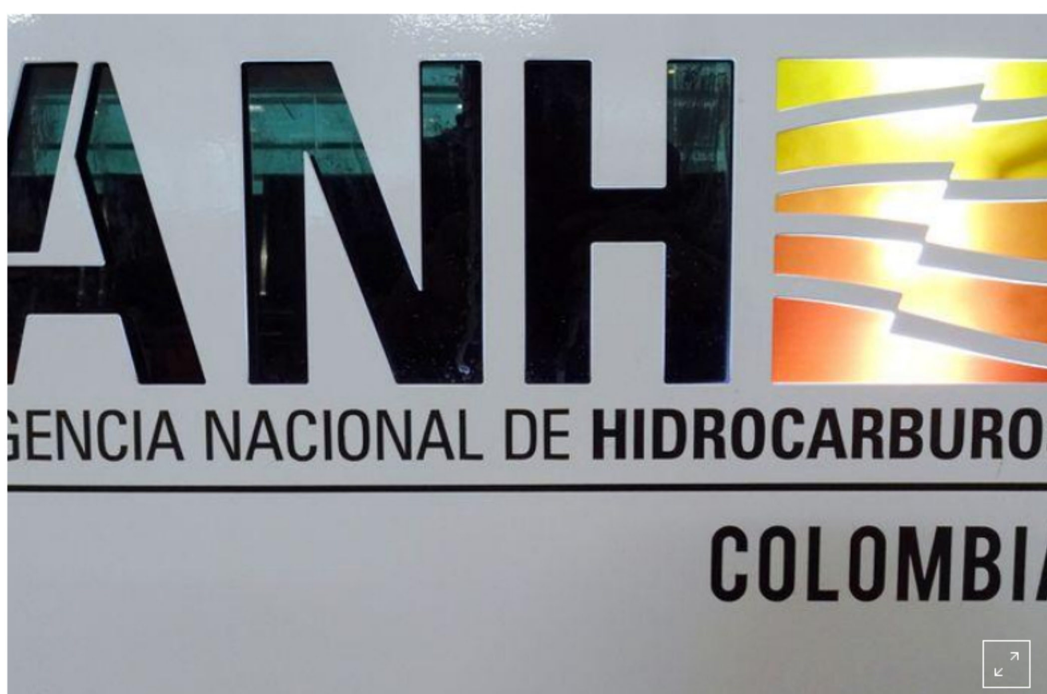
Foto de archivo del logo de la Agencia Nacional de Hidrocarburos (ANH) de Colombia. Sep 26, 2019.

BOGOTÁ (Reuters) - El Gobierno de Colombia podría llevar adelante una intervención sin precedentes en las tarifas de los oleoductos, que los productores privados han criticado por ser demasiado altas, dijo el miércoles el presidente de la Agencia Nacional de Hidrocarburos (ANH).