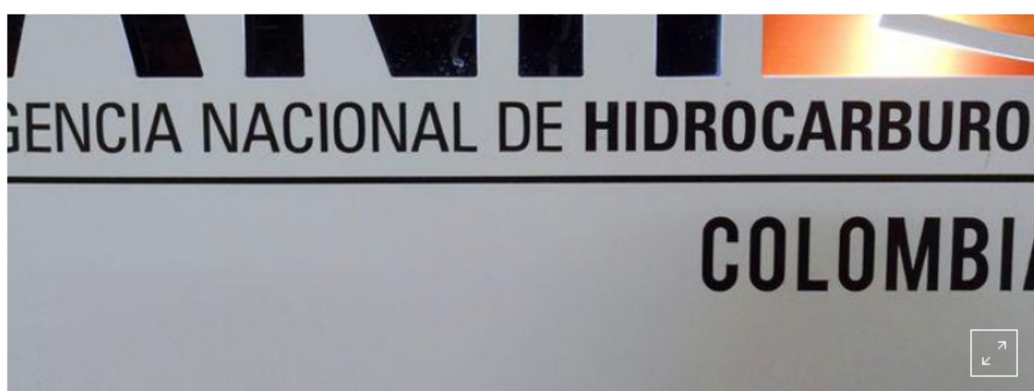
Foto de archivo del logo de la Agencia Nacional de Hidrocarburos (ANH) de Colombia. Sep 26, 2019.

La Asociación Colombiana de Petróleo (ACP) se quejó recientemente de las excesivas tarifas de transporte por los oleoductos, que están controlados por Cenit , una subsidiaria de la empresa estatal Ecopetrol .