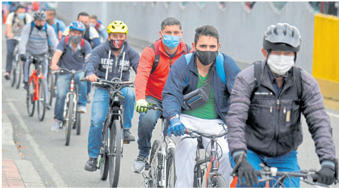
Aunque el papel de la bicicleta en la movilidad bogotana venía en alza, la pandemia ha elevado su dimensión.

Estudio de la U. de los Andes advierte que en situaciones extremas, 7,3 millones de personas entrarían en esa condición. Pág. 6