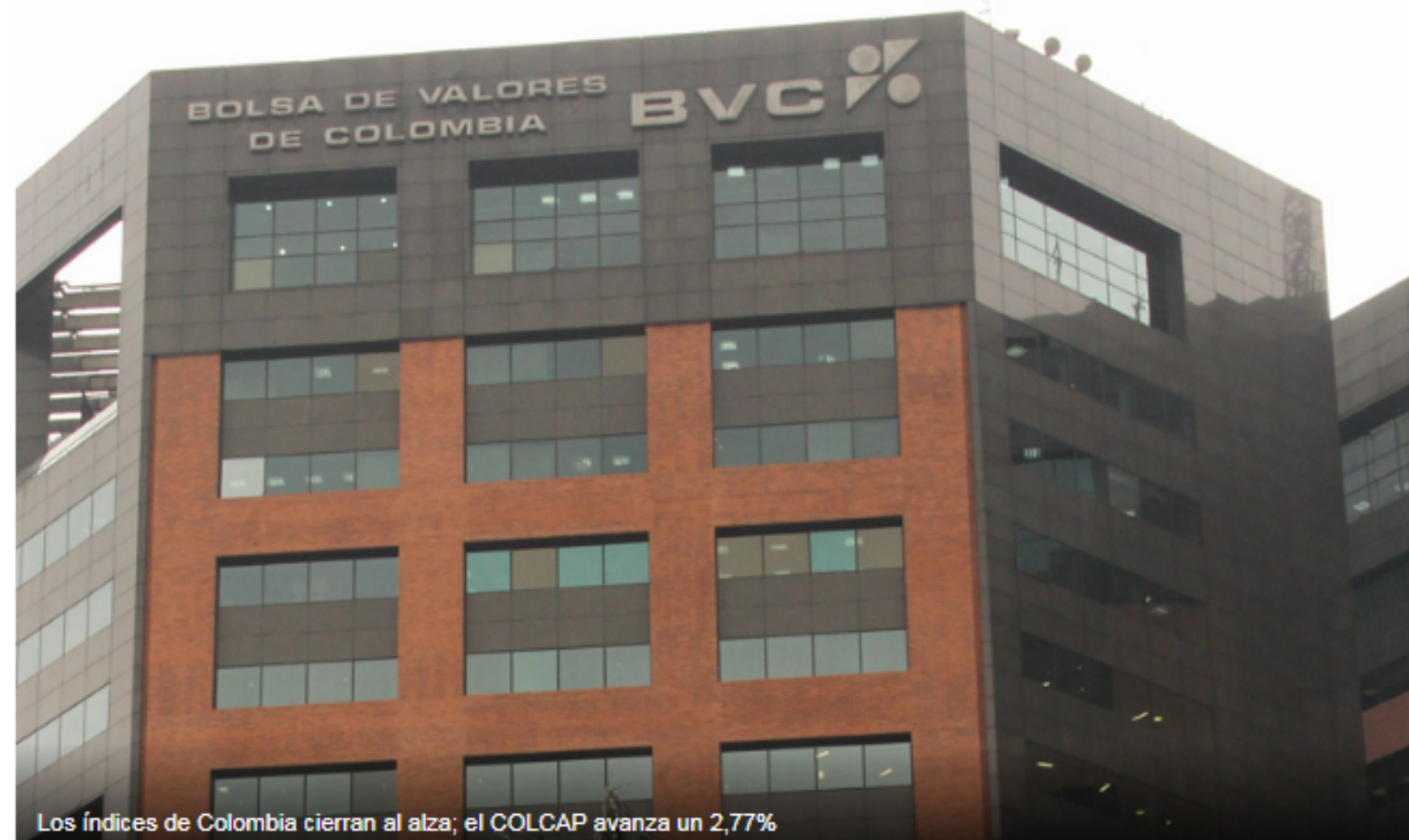
Los índices de Colombia cierran al alza; el COLCAP avanza un 2,77%