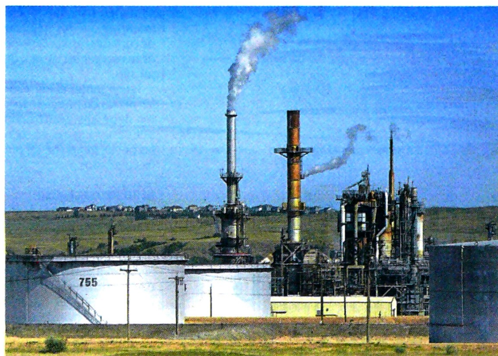
"Por la crisis, el país dejaría de producir cerca de 130.000 bpd de petróleo": ANH.

"Las reservas son las cantidades estimadas de petróleo con las que cuenta un país y son importantes para calcular la autosuficiencia energética", señaló Inés El-