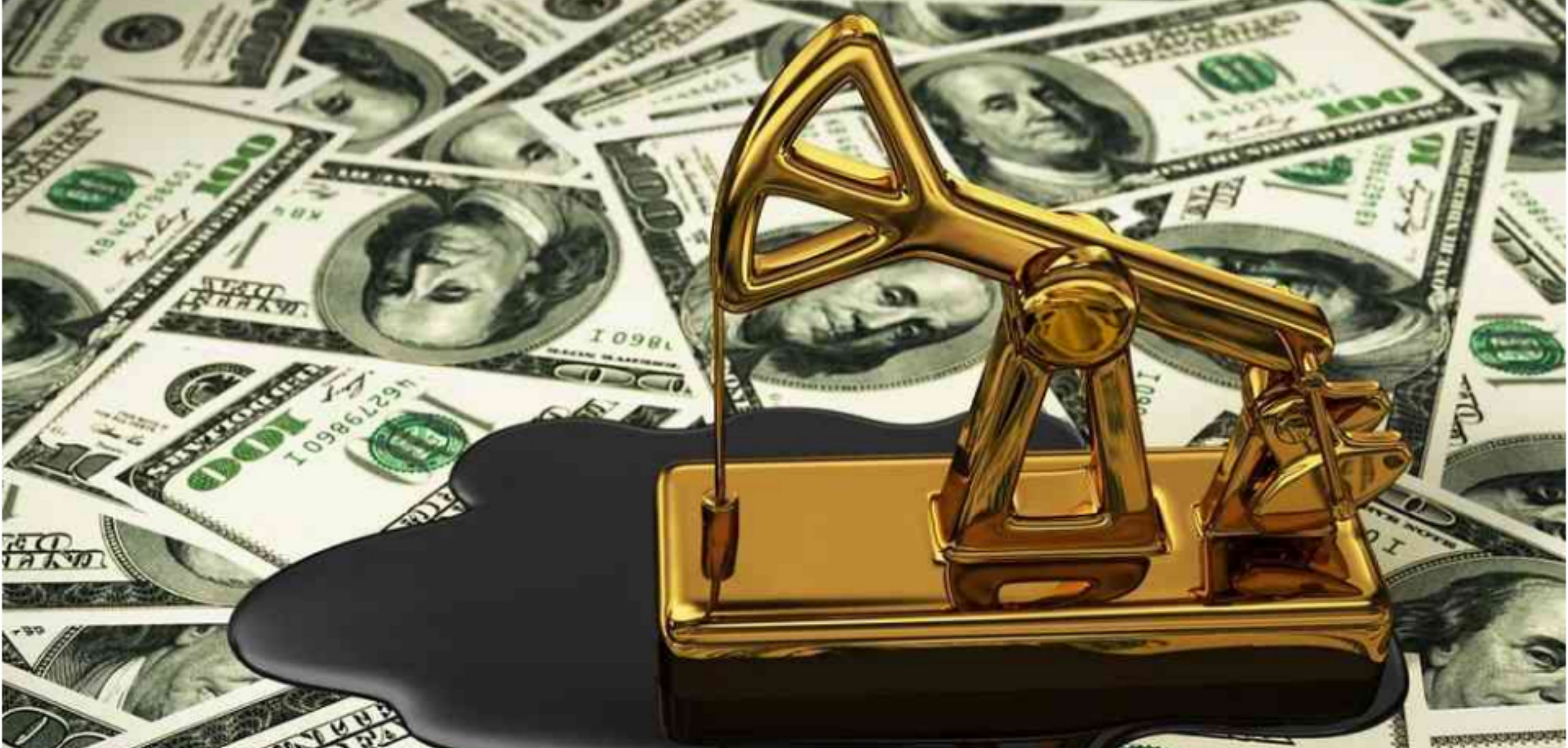
Dólar cae ante fuerte repunte del petróleo

Ante la recuperación del precio del petróleo en un 20%, el dólar presentó un gap de apertura de casi $60 fortaleciendo la divisa a niveles de $3.945.