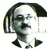
Gustavo Toro Presidente de Cotelco

La conectividad, el empleo y la importancia de la aerolínea para la reactivación son algunas de las razones que argumentan los que están a favor de ayudar a Avianca . Su situación no es aislada. Delta , KLM , American Airlines y Lufthansa han recibido apoyo de los Gobiernos . LR habló con expertos en el tema para conocer 10 razones por las que el Estado debe ayudar a Avianca .