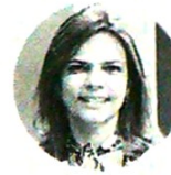
Flavia Santoro Presidente de Procolombia

“El sector turístico está ligado al sector aéreo. Una quiebra de Avianca sería fatal por el peso que tiene en el mercado y si no hay conectividad, es difícil que el sector hotelero repunte”.